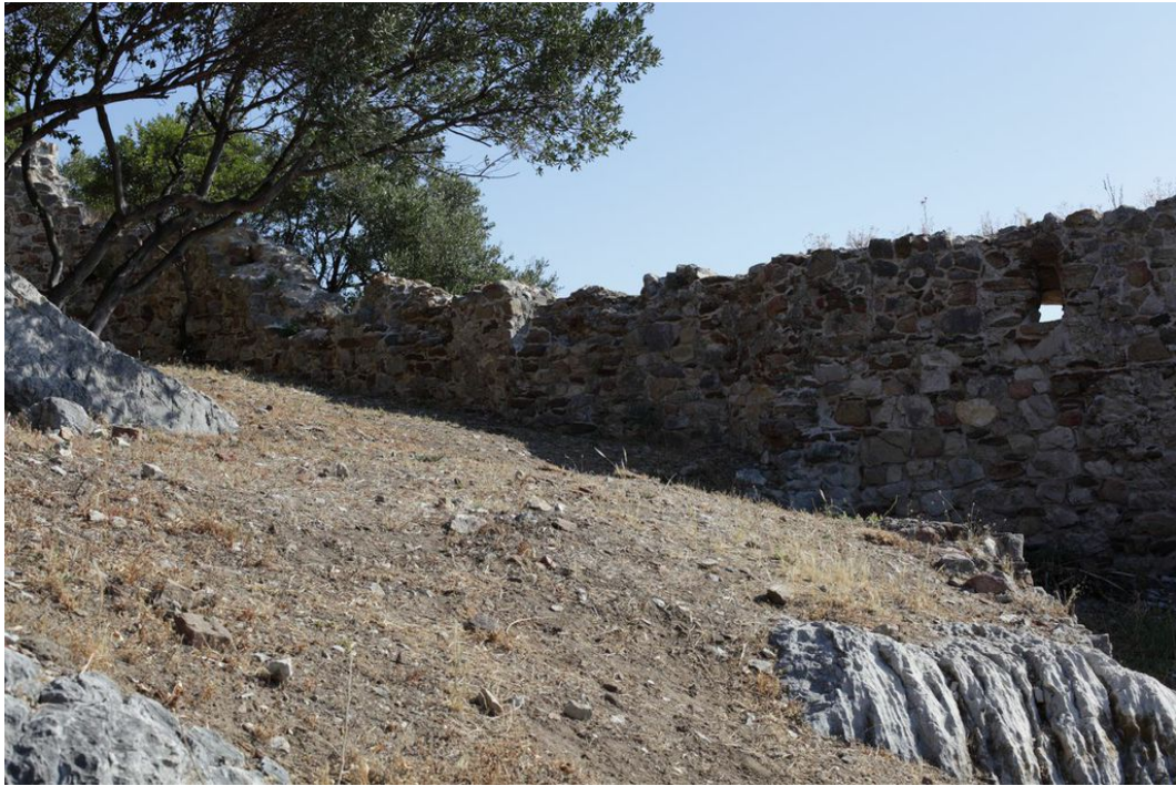
Fig. 4 - Detail of area enclosed by the inner wall.