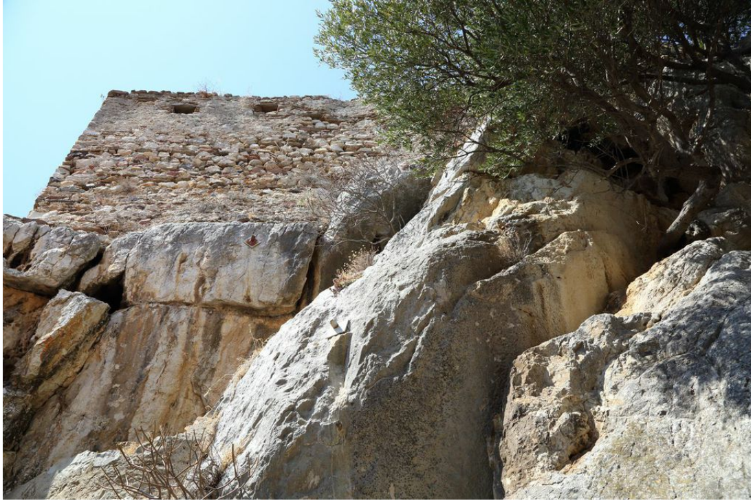
Fig. 2 - Detail of the outer walls of the castle, built directly on the rock