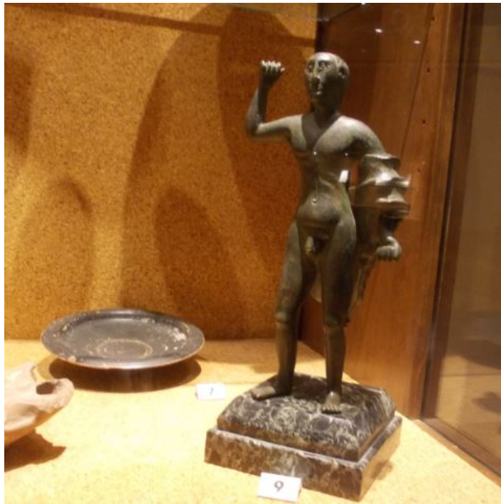
Fig. 3 - The small statue of Hercules in the display case at the Cagliari Archaeological Museum.