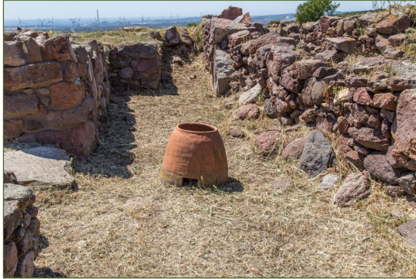
Fig. 3 - Reconstruction of tannur

They are dolii, still used in more traditional North Africa today. In the Phoenician and Punic world, they sometimes have fingermarks pressed around the outer edge.