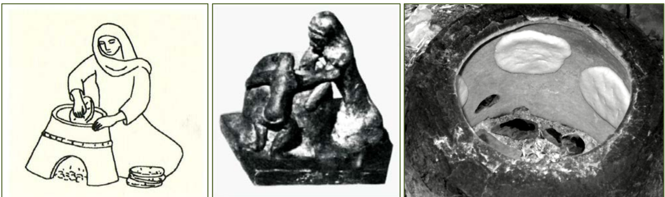
Figs. 4, 6 - Preparation of bread (CAMPANELLA 2008, p. 146; DI GENNARO, DEPALMAS 2011, fig. 2b; terracotta from Punic tomb of Carthage, of a woman and child around a tannur: DI GENNARO, DEPALMAS 2011, fig. 3)

They are dolii, still used in more traditional North Africa today. In the Phoenician and Punic world, they sometimes have fingermarks pressed around the outer edge.