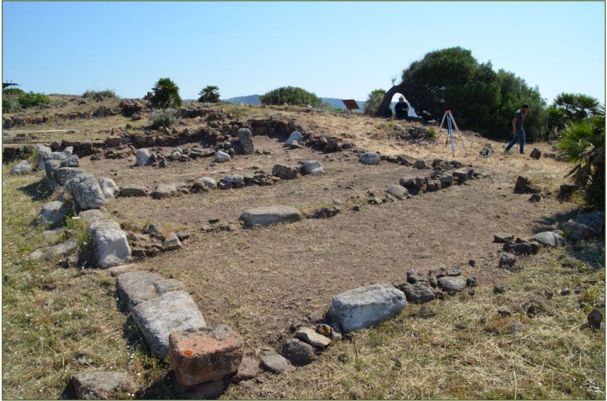
Fig. 3 - The "Casa di tufo", 2015 dig.

The dig in 2014 showed a complex building, with five rooms and a heavy use of tufa rock, hence the name, available in rocky outcrops on the acropolis, used for laying isodomic blocks. It was used between the 3rd and 2nd centuries BC.