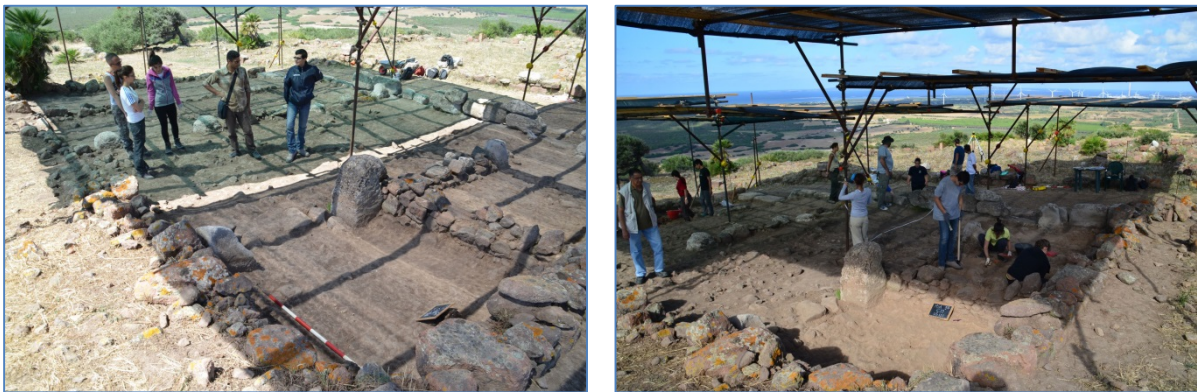
Figs. 6, 7 - Monte Sirai, June-July 2015: excavations in the 'tuff House'.