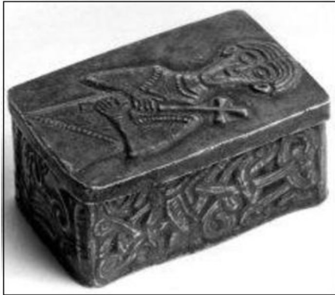
Abb. 2 - Silber-Reliquiar von Sant'Apollinare, 6. bis 7. Jahrhundert.