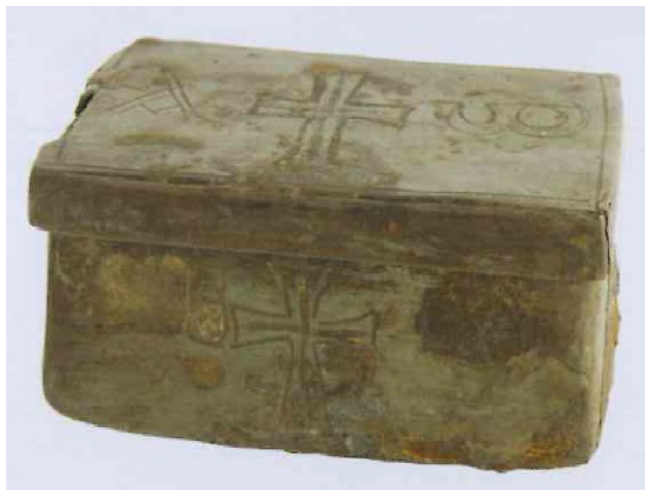
Abb. 3 - Silber-Reliquiar aus der Kirche S. Andrea, Rimini, 5. bis 6. Jahrhundert.