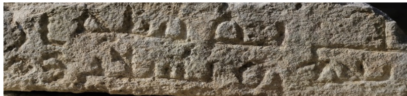
Abb. 3 - Arabische Inschrift Detail.