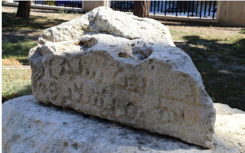
Abb. 2 - Arabische Inschrift.