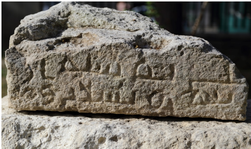
Abb. 1 - Arabische Inschrift

In Cagliari wurde in einem Steinhaufen im Inneren des Komplexes von San Saturnino vor Kurzem eine Grabinschrift in arabischer Sprache gefunden, graviert in einen 37,8 cm hohen, 67,5 cm langen und 40 cm tiefen Block aus lokalem Kalkstein, der wahrscheinlich zur Wiederverwendung auf einer Seite bearbeitet wurde (Abb. 1-3). Das Ende des Textes, angeordnet in zwei Zeilen, ist lesbar: (...) sanat arba'at wa-tis'în wa-mâ'tîn , zu übersetzen mit: „(im) Jahr zweihundertvierundneunzig“, was eine Datierung auf die Zeit zwischen 900 und 907 n. Chr. gestattet. (Abb. 4). Der Fund stellt für die Erforschung der arabischen Präsenz in Sardinien eine wichtige Neuheit dar und ist wahrscheinlich ein Anzeichen für die Präsenz von Personen islamischer Kultur in Cagliari..