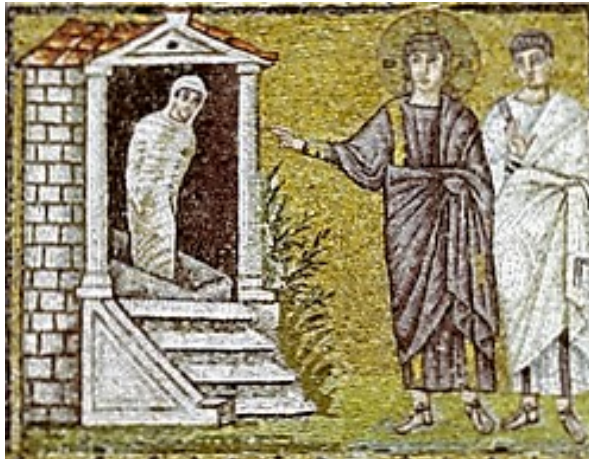
Abb. 3 - Resurrection of Lazarus, mosaics of San Apollinare Nuovo, Ravenna, 5th-6th century (from http://www.mosaicocidm.it/Mosaico/Read_full.action%3Bsessionid=A62056260E798CB40C0E1228636CC8BB?cardNumber=61&leaves=0 ).