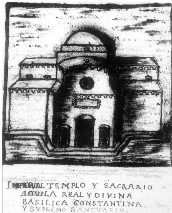
Abb. 1 - Zeichnung der Basilika S. Saturnino aus dem 17. Jahrhundert (aus: Carmona 1631, Bl. 62v)