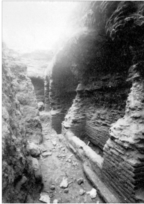
Abb. 4 - Bestattungsraum unter der Kirche S. Lucifero im Jahr 1947-48 (aus: Mureddu et alii 1988, S. 159)