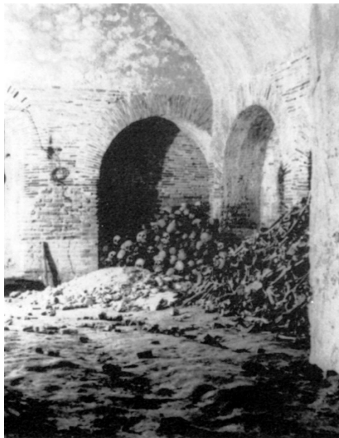
Abb. 3 - Raum unter der Kirche S. Lucifero im Jahr 1937 (aus: Mureddu et alii 1988, S. 154).

In den 30er und 40er Jahren wurden bei Restaurierungsarbeiten Räumen unter der Kirche S. Lucifero gefunden (Abb. 3-4), die restauriert wurden.