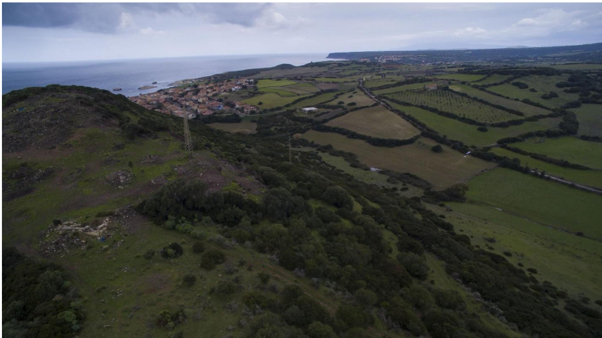
Abb. 2 - Campu 'e Corra: Corchinas-Hügel und Umland.

Die in Campu 'e Corra (Abb. 2) gefundenen Villen sind die von Sisiddu (Abb. 3) und Lenaghe sowie die vermutete in Columbaris, wo später der christliche Komplex entstand.