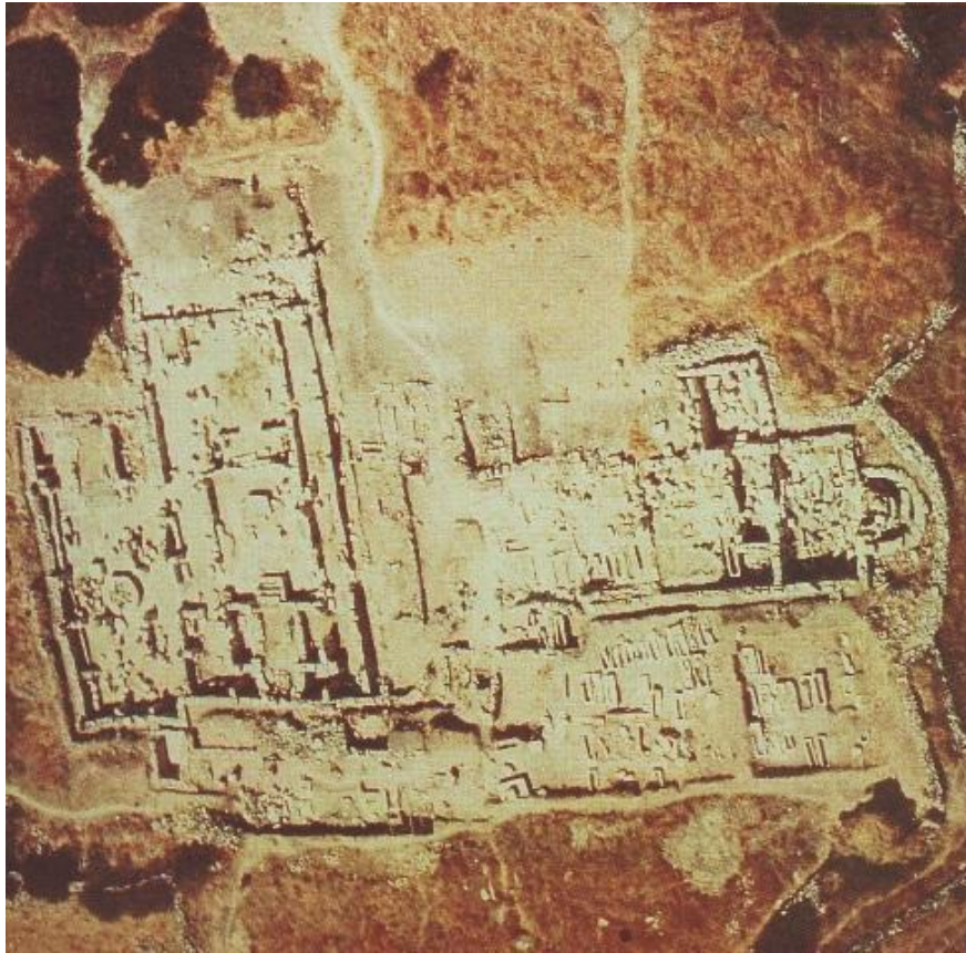
Abb. 2 - Cornus-Columbaris: Ansicht des Bezirks der Basiliken von oben (aus: Cornus I.1, S. 36, Abb. 15).

Die Präsenz des Zentrums von Cornus, wahrscheinlich auf dem Hügel von Corchinas, sowie des nicht weit entfernten Bezirks der Basiliken von Columbaris, könnte die Bezeichnung des Zentrum mit zwei unterschiedlichen Namen erklären, die punisch-römische Stadt Cornus und der civitas nuova Senafer .