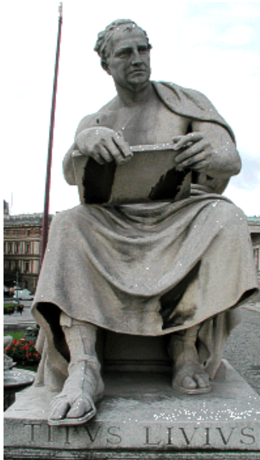
Abb. 4 - Statue von Titus Livius in Padua, seiner Geburtsstadt

( http://www.miti3000.it/mito/libri/imagesd41d.htm?http://www.miti3000.it/mito/libri/img/Tito_Livio_Padova.gif ).