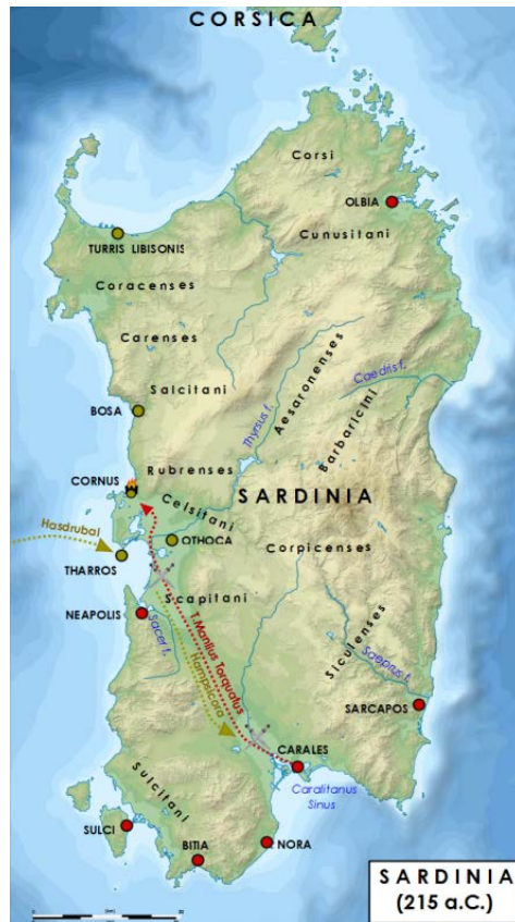
Abb. 5 - Weg der Truppen und Schlachtfelder der Schlacht von Cornus.

Die erste Begegnung, die wahrscheinlich in der Nähe von San Vero Milis erfolgte, führte zur Niederlage der Rebellen, die in die Flucht geschlagen wurden. Die kriegerischen Auseinandersetzungen endeten nicht mit dieser Niederlage, sondern sie flammten wieder auf, als die karthagische Flotten vor Sardinien gesichtet wurde, rechtzeitig, um die Aufständischen zu unterstützen. Es ist nicht bekannt, wo die Flotte landete, wahrscheinlich ist jedoch Korakodes Portus , 5 Seemeilen (ca. 9 km) südwestlich von Cornus. Die punischen Streitkräfte unter der Führung von Hasdrubale, Osto und Hampsicora zogen erneut nach Karales und richteten große Verwüstungen an. In einer Ortschaft, die sich wahrscheinlich zwischen Sestu und Decimo befindet, vielleicht bei Sanluri, fand die zweite Schlacht statt, bei der die Römer dank des Weitblicks von Manlius Torquatus ebenfalls siegte. Auf dem Schlachtfeld starben ca. 12.000 Soldaten auf der sardisch-punischen Seite, darunter auch Osto, während Hampsicora sich in der Nacht selbst das Leben nahm, nachdem er vom Tod seines Sohns erfahren hatte, um sich der Festnahme zu entziehen.