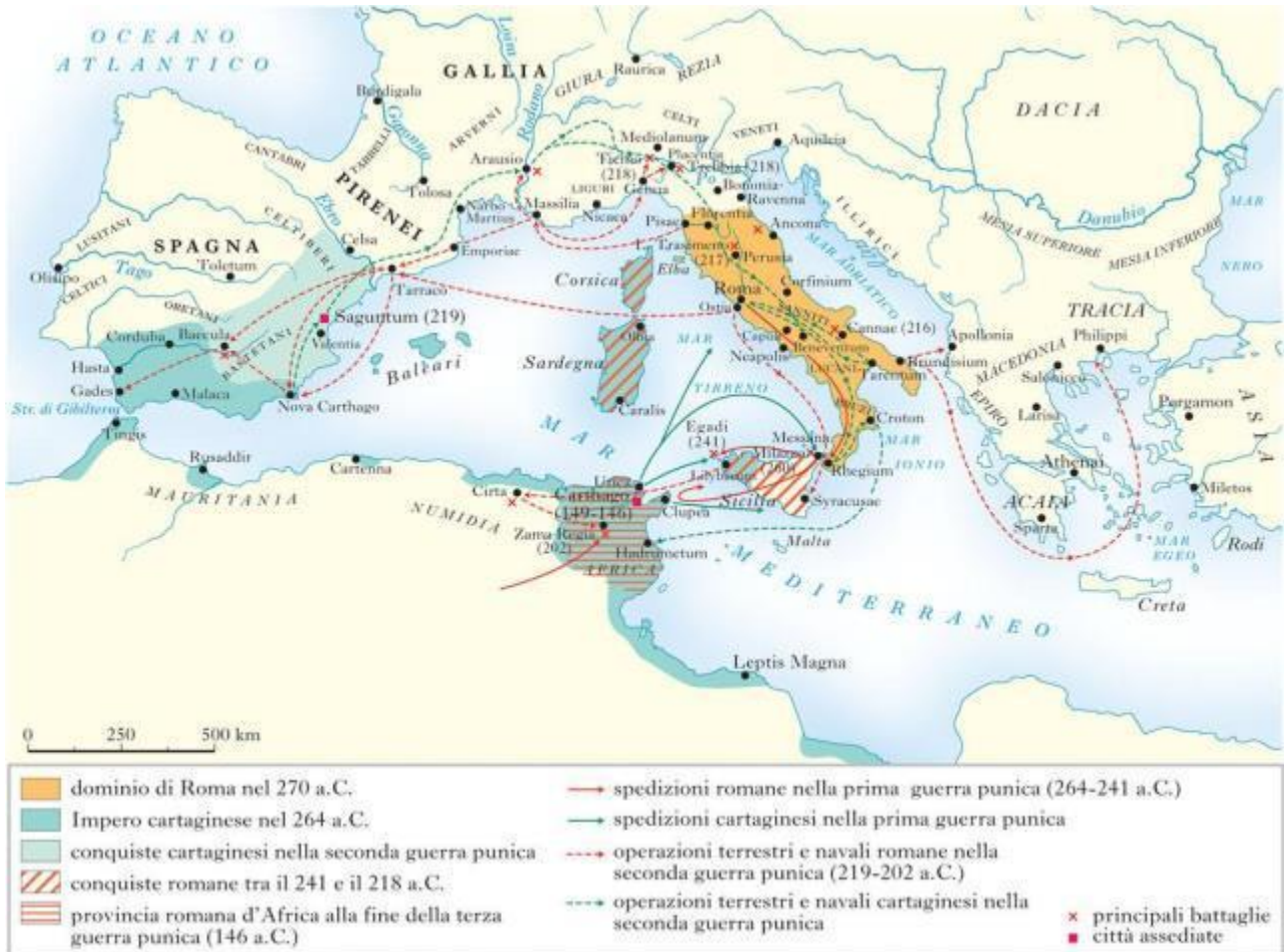
Abb. 1 - Grafische Darstellung der Geschichte der punische Kriege.

Sardinien gelangte 238 v. Chr. in römischen Besitz, nach zwei Jahrhunderten punischer Herrschaft, nachdem dieses Volk durch Rom besiegt wurde (Abb. 1).