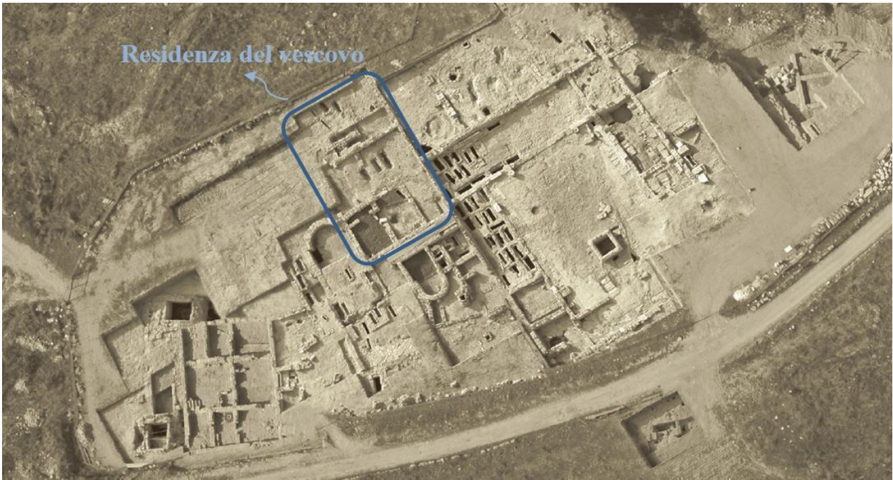
Abb. 6 - Ansicht des frühchristlichen Komplexes von S. Pietro a Canosa von oben (aus: VOLPE 2007, S. 135, Abb. 135 - grafische Überarbeitung von F. Collu).