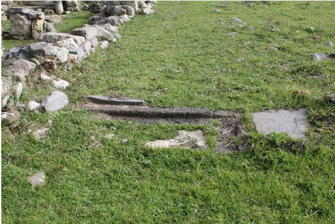
Abb. 2 - Eingangsschwelle zum Quadriportikus.

Die gefundenen Räume wurden teilweise untersucht: Auf Grundlage der erfassten Daten sowie der Unmöglichkeit einer anderen Lage in der Nähe des Komplexes wurde die Hypothese aufgestellt, dass es sich um einen Teil des Episkopalpalasts handelt. Dabei handelt es sich um den permanenten oder vorübergehenden Wohnsitz des Bischofs der Diözese: Dauerhaft, falls die Kathedrale von Columbaris der Hauptsitz der Diözese Senafer/Cornus war, von der die Quellen berichten; provisorisch, falls der Komplex als ländliches Episkopalsitz zu interpretieren ist, an dem sich der Bischof gelegentlich für einige Tage aufhielt, bevor er sich wieder auf die Rückreise machte.