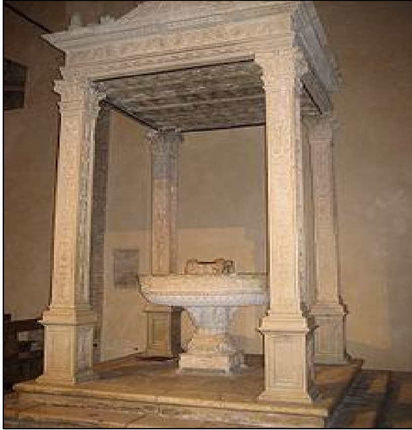
Abb. 3 - Baldachin über dem Taufbecken von Santa Maria Assunta in Atri ( http://it.wikipedia.org/wiki/Basilica_di_Santa_Maria_Assunta_(Atri)#mediaviewer/File:Battistero,_Paolo_de_Garviis_(1503).jpg ).