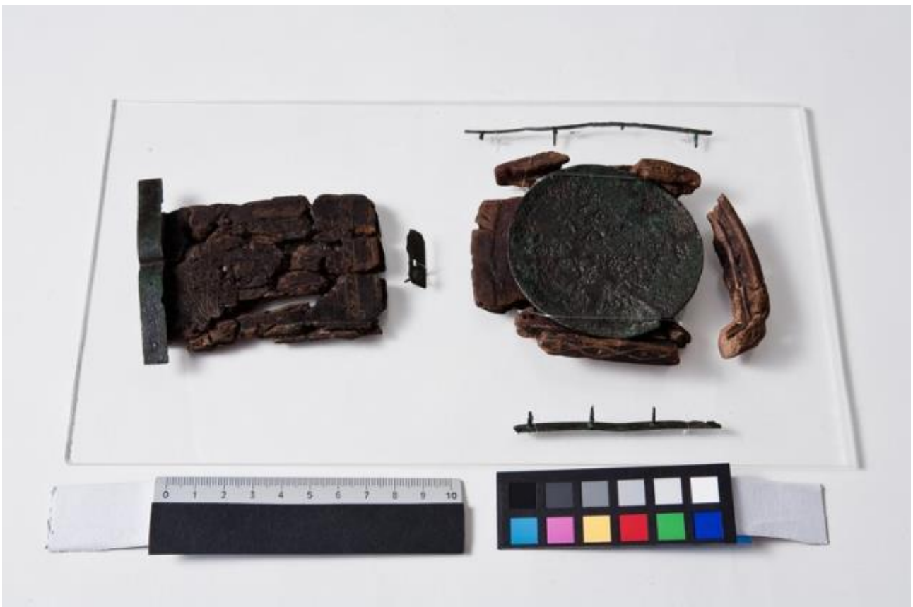
Abb. 1 - Behältnis aus Kork und Bronzespiegel.