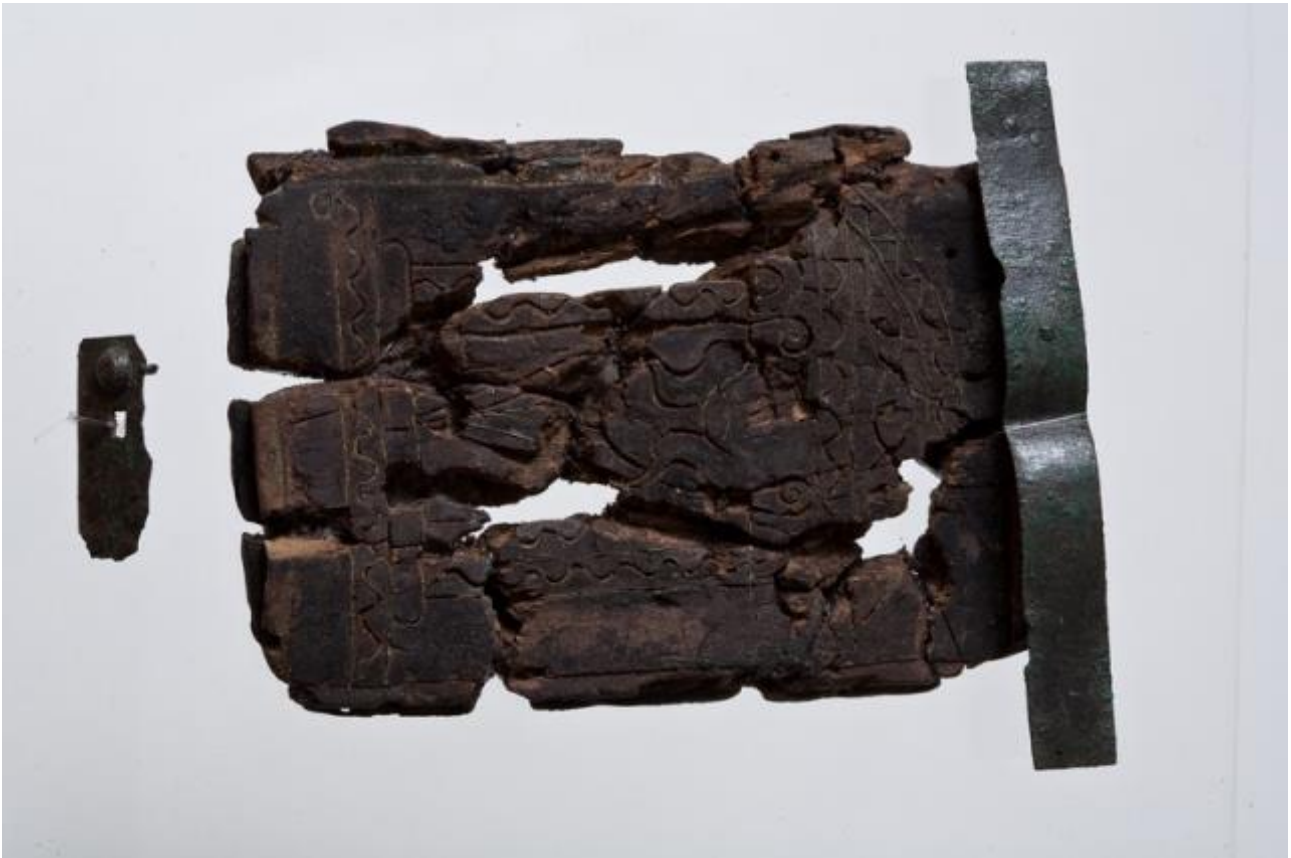
Abb. 4 - Behältnis aus Kork mit Dekor.