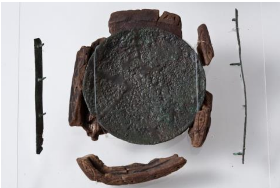
Abb. 3 - Bronzespiegel.

Das Erzeugnis besteht aus einer Bronzescheibe mit einer reflektierenden konkaven Seite, ohne Dekor (Abb. 3), das seit der Etruskerzeit verwendet wurde.