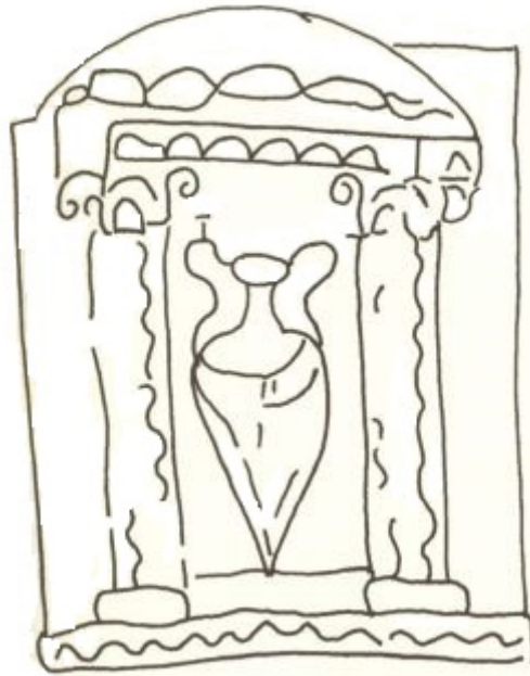
Abb. 5 - Grafische Darstellung des Dekors des Behältnisses aus Kork (aus: MARTORELLI 2005, S. 29, Abb. 3).

Das Erzeugnis stellt bis heute ein Unikum dar, sowohl hinsichtlich des Materials, als auch hinsichtlich des in den Deckel gravierten Dekormotivs: Letzteres ist bekannt von anderen Objekttypen, vor allem aus Bestattungskontexten, wie Platten, es erscheint jedoch gelegentlich auch bei Gebrauchsgegenständen. Es wurde angenommen, dass die Darstellung sich nicht auf einen Moment des realen Lebens bezieht, sondern einen symbolischen Wert hat. Die Form der Amphore scheint eine Abwandlung einiger Transportbehälter, die im westlichen Mittelmeerraum vor allem zwischen dem 4. Jahrhundert und dem 7. Jahrhundert n. Chr. benutzt wurden. (siehe Abb. 6).