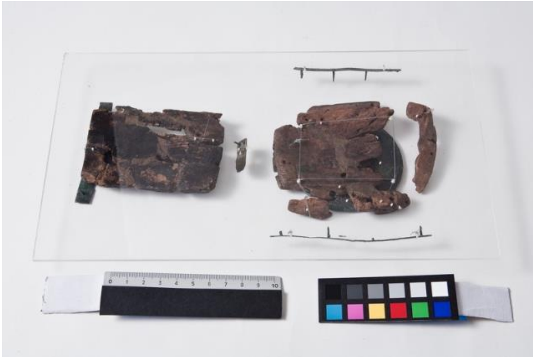
Abb. 2 - Behältnis aus Kork und Bronzespiegel.

Das Erzeugnis besteht aus einer Bronzescheibe mit einer reflektierenden konkaven Seite, ohne Dekor (Abb. 3), das seit der Etruskerzeit verwendet wurde.