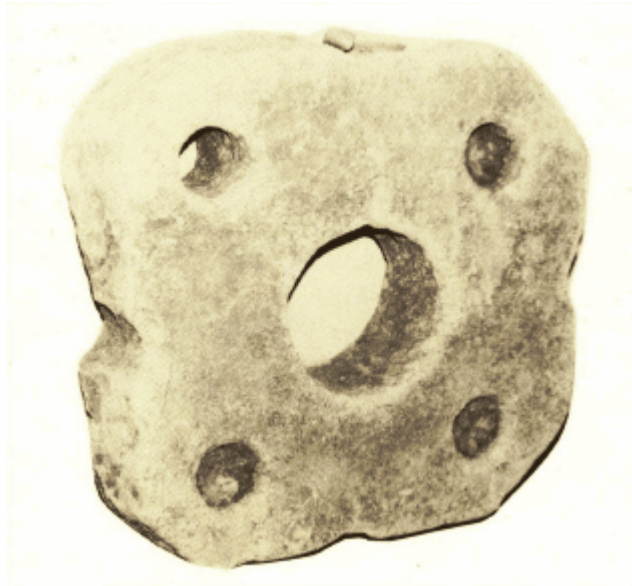
Abb. 2 - Villaputzu, Ortschaft Longu Fluminu: gelochter Stein (aus: Ledda 1989, S. 354, Tafel XCVII, Abb. 4).