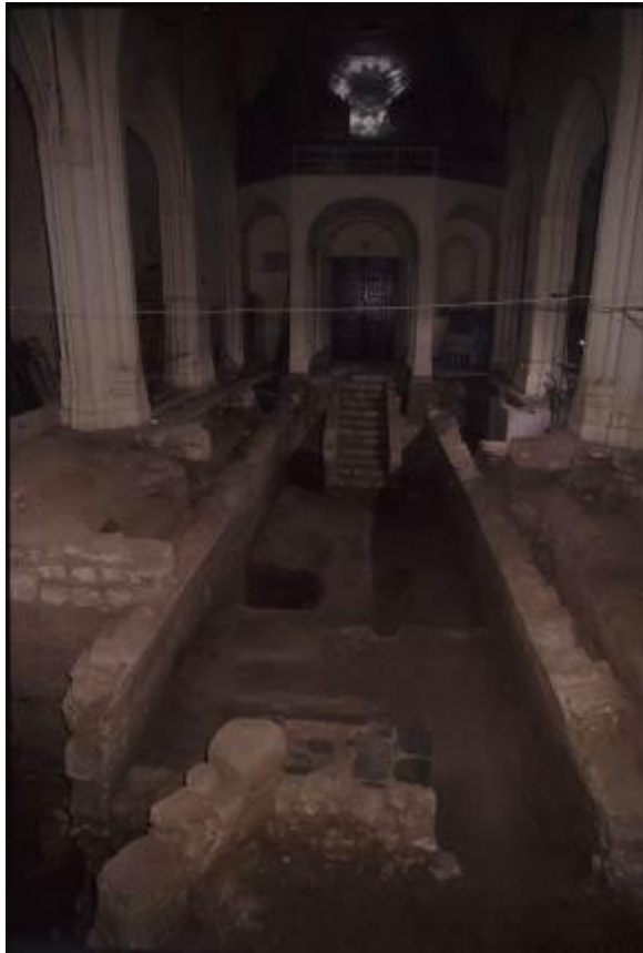
Abb. 2 - Nachfolgende Phase der Grabungsarbeiten im Inneren der Kirche: Die große Krypta wies einen Altar aus Andesitplatte sowie eine Treppe auf, die die Krypta mit der Kirche verband.

Eine Zugangstreppe verband die Kirche mit der Krypta: Die 12 erhaltenen Stufen (während der Grabungsarbeiten aus statischen Gründen abgerissen) befanden sich im Westen und führten zu einem Raum mit rechteckigen Grundriss (ca. 13,50 x 4,80 m), der ursprünglich ein Tonnengewölbe aufwies, in dessen südöstlichen Bereich sich ein mit Schieferplatten verblendeter Altar mit den Abmessungen 1,80 x 0,80 m befand. Unter der nicht erhaltenen Bodenebene belegen an die hundert Gräber, dass die Krypta für Bestattungen genutzt wurde: Um den gesamten verfügbaren Raum auszunutzen, wurden die Gräber auf mehreren Ebene angelegt (Abb. 3).