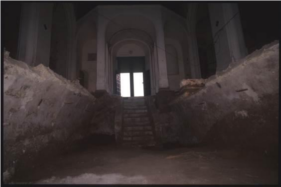
Abb. 1 - Zentrale Krypta während der Grabungsarbeiten im Inneren der Kirche. Die Decke der Krypta wies ein Gewölbe auf.

Unter dem Mittelschiff der Kirche Sant'Eulalia (Abb. 1-2), wurde zwischen dem 17. und Anfang des 18. Jahrhunderts 1 die größte der 7 im Bezirk gefundenen Krypten errichtet 2 .