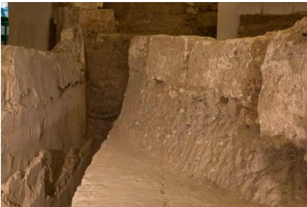
Abb. 1 - Mauerrest des Gebäudes, das auf einer starken Sedimentschicht errichtet wurde. Seine Fortsetzung ruhte auf den abgetragenen Strukturen des Portikusses (Foto von Unicity S.p.A.).

Im Bereich, der zuvor von der Fundamentmauer der Kolonnade eingenommen wurde, verdeckt durch eine Aufschüttung (Abb. 1), wurde ein großer viereckiger Raum errichtet, der auf der Westseite mit der gepflasterten Straße ausgerichtet ist, insbesondere in Fortsetzung der Mauer aus opus africanum , die errichtet wurde, um die ursprüngliche Breite der Straße einzuschränken (Abb. 2) 1 .