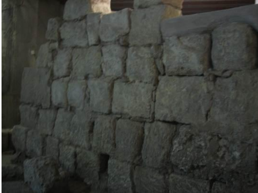
Abb. 3 - Wand aus unregelmäßigem opus quadratum (Foto von R. Martorelli).