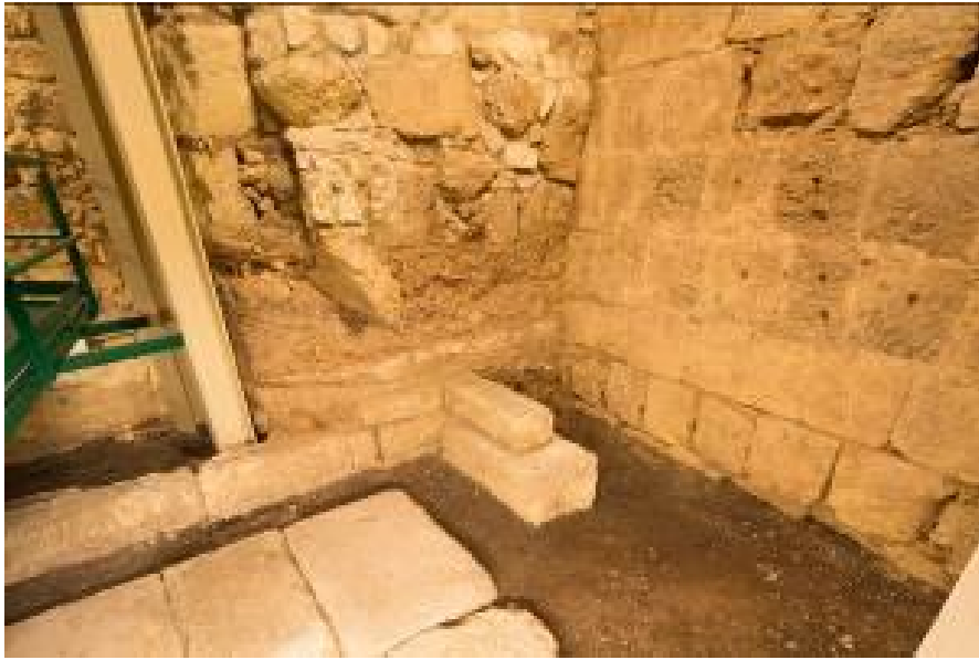
Abb. 3 - Erhaltener Teil des Temenos.