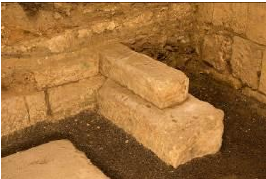
Abb. 4 - Detail der Ecke des Temenos.

Es ist noch unklar, welcher Gottheit er geweiht war. Aus der Untersuchung vergleichbarer italischer Heiligtümer ergibt sich, dass Apollo eine der Gottheiten ist, die in diesen Kontexten am besten belegt ist 3 ; es wird hingegen auch die Hypothese vorgebracht, dass Baalshamem , die phönizische Gottheit der Wetterphänomene, der