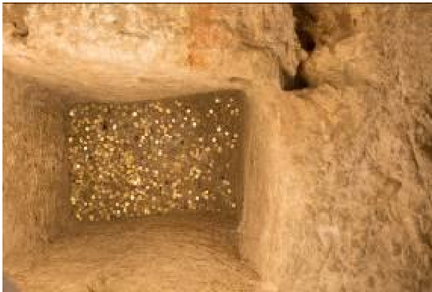
Abb. 3 - Thesaurus.

Oben öffnet sich an der Basis ein viereckiger Schacht (76 x 110 cm), Tiefe 140 cm (Abb. 4 B, D, E). Im Inneren des Schachts, abgedeckt mit Erde und Asche, wurden Fundstücke aus Keramik und Metall gefunden, darunter 307 Münzen aus der punischen und der römi-