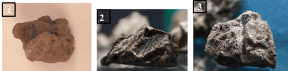
Abb. 1 - 3 - Schlacken: 1 – AFS; 2-3 – (Foto von Unicity S.p.A.).

Die Tiegel und Abfälle aus Glas (Abb. 1-4) 1 und Eisenmaterial 2 , die im südöstlichen Viertel des Bezirks von Sant'Eulalia und im nordwestlichen Bereich der gepflasterten Straße gefunden wurden, stammen aus einem Handwerksgebiet.