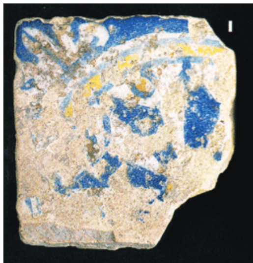
Abb. 3 - Fragment einer azulejo aus dem Vico III Lanusei (aus: Carta 2006, S. 235, Abb. 152).

Das erste ist vergleichbar mit zwei anderen Fundstücken aus Cagliari, das heißt, aus dem Vico III Lanusei (Abb. 3) 1 und der Via Cavour (Abb. 4) 2 : Dieser Fliese mit unabhängiger Zelle 3 weist in der Mitte ein rundes gelbes Medaillon auf, in dem ein Stern oder eine Windrose in Weiß und Blau eingeschlossen ist, mit goldenen Perlen zwischen den Blütenblättern; die 4 Ecken weisen weitere Zierelemente mit Wellenform auf, weiß auf blauem Grund. Auf der Grundlage stilistischer Vergleiche sowie des Tons wird das Exemplar auf Ende 16. Jahrhundert bis Anfang 17. Jahrhundert datiert und es wird angenommen, dass es wahrscheinlich aus einer katalanischen Werkstatt stammt.