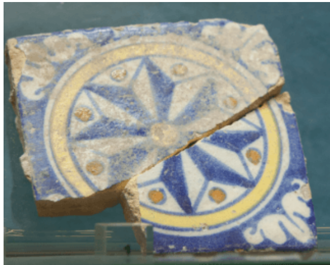
Abb. 1 - Azulejo mit Dekor "Windrose" aus S. Eulalia.

In der Fundstätte Sant'Eulalia wurden vereinzelte Exemplare von Azulejos oder rejos gefunden, das heißt Ziegel mit Majolika oder einfach lackiert, die als Bodenbelag oder für Wandverzierungen verwendet wurden: Ein Fundstück weist das Dekormotiv „Windrose“ auf (Abb. 1), bei einem zweiten füllen pflanzliche Elemente und Linien (Abb. 2) die Fläche.