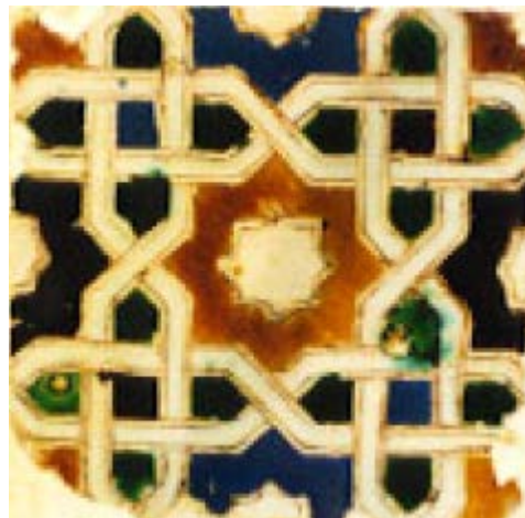
Abb. 5 - Laggione im islamischen Stil abgeleitet von den Alicatados (von http://www.poterie.it/pdf/azul3x.pdf ).

waren Sevilla und Toledo; sie hatten große Verbreitung (17. - 18. Jahrhundert), auch in Lateinamerika; die in Sardinien gefundenen Exemplare stammen aus Werkstätten in Sevilla, Murcia, Valencia und Barcelona 5 sowie aus Ligurien (mit Renaissance-Einfluss in den Motiven 6 ) und überwiegend aus dem 15. Jahrhundert. Im 15. Jahrhundert wurden für diese Produktion zwei spezifische Techniken angewendet: der Dekorprozess mit Cuerda Seca sowie der mit Cuenca . Beim ersten wurde die Randlinie mit einer Form in den frischen Ton eingedrückt (Abb. 5): Das Manganamalgam mit einer fettigen Substanz diente zur Definition der Figuren sowie zum Schutz gegen ein eventuelles Austreten der Glasur während des Brennens; beim Cuenca -Verfahren führte das Eindrücken des Werkzeugs zu Relieflinien des Motivs, um so eine Trennung der Flächen zu gewährleisten 7 .