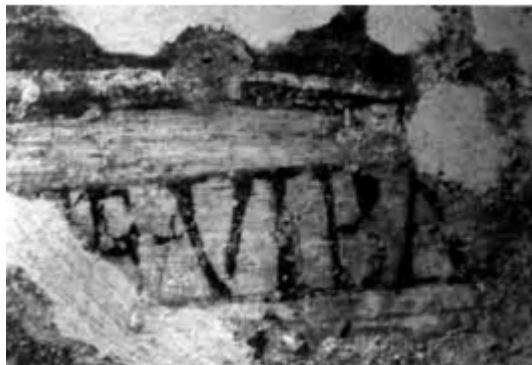
Abb. 4 - Sant'Antioco, Detail der aufgemalten Inschrift E VIBA im Arkosolium C/VII (aus: Nieddu 2011, S. 82, Abb. 5).