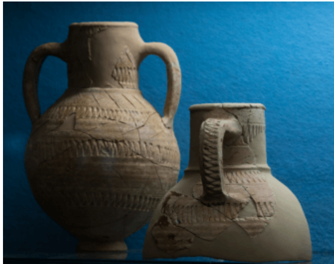
Abb. 4 - Kleine zweihenklige Amphore und einhenkliger Krug mit aufgemaltem mit Zickzack.

Amphoren und Krügen gefunden, die bei Wasserholen zerbrochen sind 3 : kleine Rippenamphoren mit einem oder zwei Henkeln, mit Zickzack-Muster (Abb. 4), in einigen Fällen auf dem gesamten Körper, in anderen an der Schulter, diagonale und horizontale Kammuster, die geometrische Motive bilden (Abb. 2); kleine Rippenamphoren aus der byzantinischen Zeit; Amphoren aus afrikanischer Produktion; eine Amphore aus Bronze (Abb. 5) sowie so genannte „geflamnte“ Keramikkrüge 4 (Abb. 1-2).