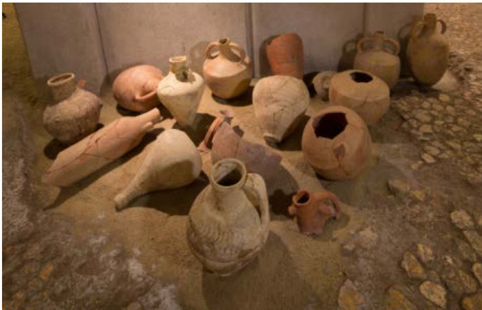
Abb. 1 - Amphoren und Krüge, die in der Zisterne gefunden wurden (Unicity S.p.A.).

Zum Zeitpunkt der Entdeckung war die Flaschen-Zisterne 1 im Bodenbelag des Portikusses von S. Eulalia mit einem trapezförmigen Stein verschlossen und sie enthielt einen interessanten und ungewöhnlichen Inhalt. Bei der Untersuchung des Kontextes wurden verschiedene Klassen von Keramik sowie Material unterschiedlicher Natur und Funktion in drei Schichten gefunden 2 : Es handelt sich um Amphoren, darunter Rippenamphoren und Krüge (Abb. 1-3), eine Amphore aus Bronze, Spardosen und Münzen, Dachziegel sowie Putz-Fragmente, davon eins mit Inschrift (Abb. 6), Küchenware aus afrikanischer Produktion, Geschirr aus Sigillata D sowie Keramik mit schwarzem Lack.