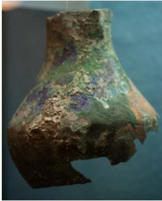
Abb. 5 - Krug aus Bronze Krug mit Verkrustungen und Patina.

Es ergibt sich sowie eine Chronologie, die zeitgleich mit der Errichtung des Portikusses (4. Jahrhundert) ist und bis ins nachfolgende Jahrhundert (5. Jahrhundert) reicht. Einzigartig ist die Chronologie der Münzen, die an der gleichen Stelle gefunden wurden und die den Brauch belegen, kleine Schätze anzulegen und Spardosen 5 zu benutzen: Die Münzen stammen aus einem Zeitraum, der vom 1. bis zum 5. Jahrhundert reicht 6 und sie konnte wiederverwendet werden, da das Anlagen von Schätzen nicht zu einem Wertverlust, sondern zu einem Anstieg des Werts führte. Der terminus post quem des 5. Jahrhunderts könnte zur Vorstellung einer unerklärlich frühzeitigen Außerbetriebnahme der Kanalisation führen, bezogen auf den Nutzungszeitraum des Standorts. Die Außerbetriebnahme ist mit Gewissheit für das 6. Jahrhundert belegt, als der Portikus einzustürzen begann und ein schleichender Verfall zur Wiederverwendung von Bauelementen führte, die in einem großen Tank angesammelt wurden. Dazu