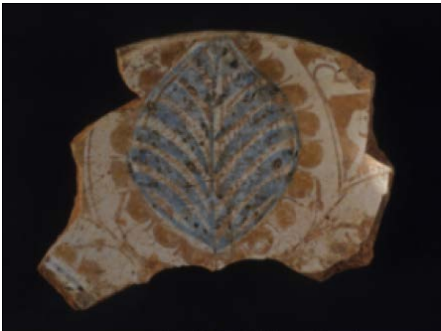
Abb. 1 - Fragmente mit vegetalem Element

Unter der südlichen Kapelle, in der noch die einzige der erhaltenen seitlichen Krypten erhalten ist, wurden einige Schichten untersucht, in denen Fragmente von iberischer Keramik aus dem 14. Jahrhundert gefunden wurden 1 , unter denen die Majoliken mit Dekor in Blau und Glanz von besonderer Bedeutung sind (Abb. 1-2). Die Restaurierung der letzteren hat es gestattet, eine halbrunde Schale zusammzusetzen (Abb. 3).