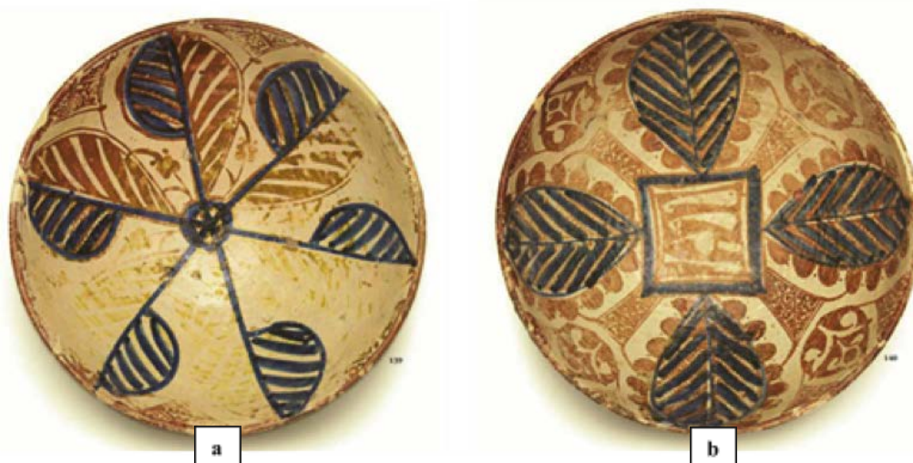
Abb. 4 - Cagliari, Nationalpinakothek: (a-b) Ciotola valenzana Tipo Pula (aus: Martorelli 2007, S. 82, Abb. 139-140).

anderen 4 sind kleiner, changierend und ausgeführt mit der gleichen metallischen Beschichtung. Die verbleibenden Räume wurden von Rauten mit ausgesparten Motiven eingenommen. Dieses Tischgeschirr aus iberischer Produktion kann vollkommen zu Recht als Luxusproduktion bezeichnet werden, die trotz der hohen Kosten seit den ersten Kontakten der Katalanen und Aragonesen eine starke Verbreitung fand 2 . Das Exemplar, das in S. Eulalia gefunden wurde, weist Analogien zu einem Fundstück aus dem sogenannten Fondo Pula auf, einer Gruppe von Erzeugnissen, deren Eigenschaft ein etwas verblasstes Lustrum ist; sie wurden in der gleichnamigen sardischen Stadt gefunden und werden in der Pinakothek von Cagliari aufbewahrt 3 (Abb. 4a). Unter den Materialien aus der Sammlung weist eine Schale aus Valencia aus der ersten Hälfte des 14. Jahrhunderts starke Ähnlichkeit mit der in der Krypta gefundenen auf 4 (Abb. 4b).