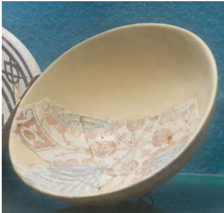
Abb. 3 - Schale in Blau und Lustrum mit Ergänzung der fehlenden Teile.

Das Dekormotiv besteht aus 8 Zweigen, die sich im zentralen Punkt schneiden und an den enden die gesamte Fläche einnehmen: 4 davon enden in 4 ovalen und geäderten Blättern, ausgeführt in Kobaltblau und umgeben von kleinen Glanzsphären; die