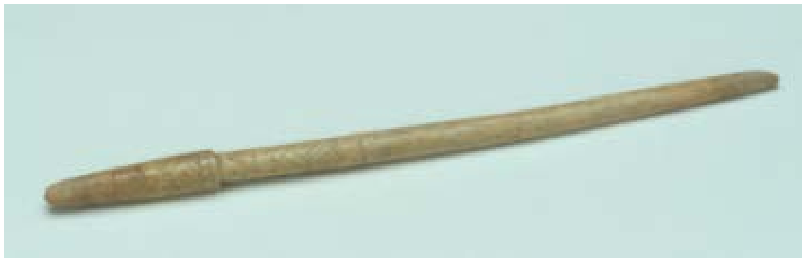
Abb. 2 - Haarnadel mit Zickzackdekor.

Das charakteristischste Exemplar weist eine glatte Büste sowie einen anthropomorphen Kopf vom Typ «Frauenbüste» 1 auf (Abb. 1a) und kann aufgrund des Vergleichs mit den