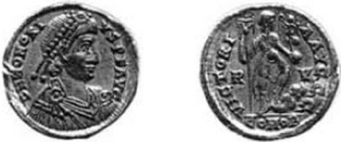
Abb. 3 - Honorius-Solidus, geprägt in der Münzanstalt Ravenna (aus: RIC X, Tafel 40, Nr. 1321).

Interessant ist die Darstellung der Büste des Honorius mit der typischen Frisur, bei der die Haare von zwei Perlenreihe gehalten werden, sowie das Gewand (vielleicht ein paludamentum ), gehalten von einer runden Brosche mit 4 Anhängern (Abb. 1). Die Ikonographie des Imperators kann verglichen werden mit einer zeitgleichen Bronzemünze, die in der archäologischen Fundstätte von Cornus im Friedhofsbezirk von Columbaris gefunden wurde (Abb. 4) 1 .