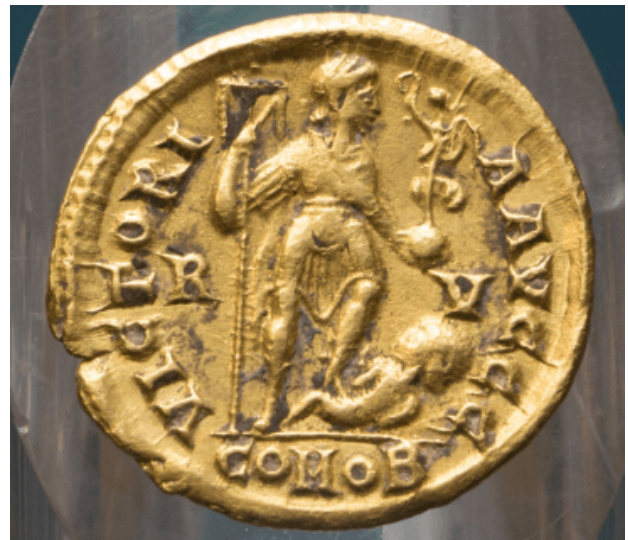
Abb. 1, 2 - Honorius-Solidus: Vorderseite (1) und Rückseite (2), (Foto von Unicity S.p.A).