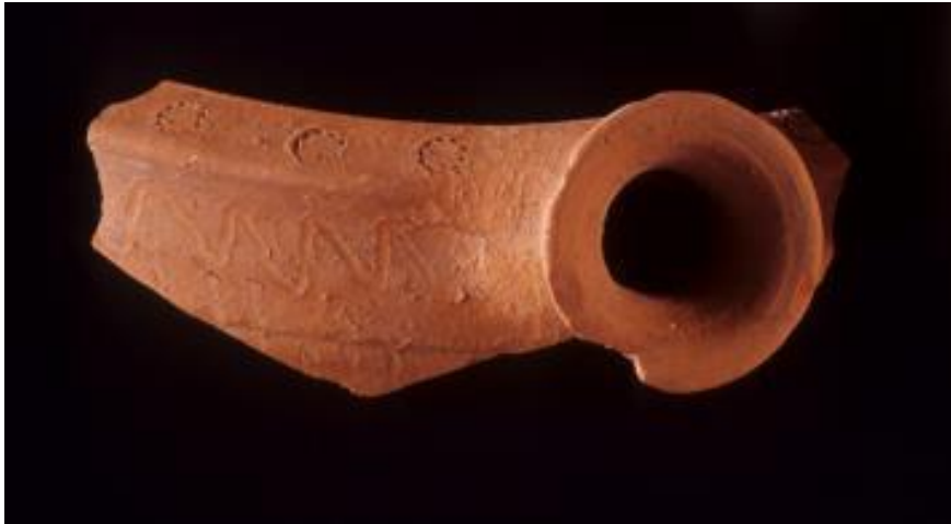
Abb. 2 - Gewöhnliche Keramik mit eingepprägten Wellen- und Kreismotiven: Kasserolle mit Ausguss (Foto von AFS).