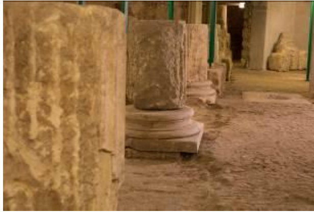
Abb. 7 - Der Portikus.

Gegen Mitte des 6. Jahrhunderts wurde Sardinien durch die Niederlage der Vandalen im Jahr 534 gegen Narses, einen General des Kaisers Justinian (527-565), zur byzantinischen Provinz. Das schwierige Zusammenleben des orientalischen Elements und der Bevölkerungen im Landesinneren von Sardinien bot den Ostgoten unter Totila die Gelegenheit, einige Städte Sardinien zu erobern und zu besetzen, darunter auch Cagliari, zwischen 551 und 552.