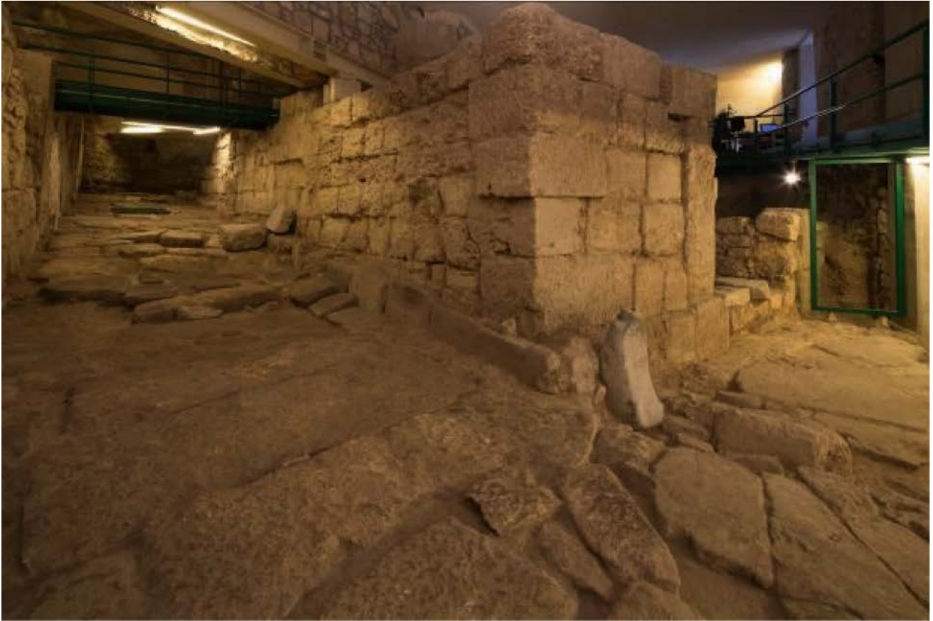
Abb. 2 - Gepflasterte Straße an den Wohngebieten.

Die aus großen Blöcken gebaute Straße hatte ursprünglich eine Breite von 4,20 Metern, sie verlief von Nordosten nach Südwesten und viel zum Meer hin ab, das in der Antike jedoch höher stand als heute. Dieses Bauwerk hob die Bedeutung des Bezirks oder der Straße selbst hervor. Die gesamte Breite ist nur in einem kurzen Abschnitt im Nordosten der Fundstätte erhalten, da die Straße wahrscheinlich gegen Ende des 6. Jahrhunderts verschmälert wurde, um mehr Platz für die private Nutzung zu schaffen. Die Oberfläche dieser Arterie weist drei Brunnen auf, die in der Antike zur Wartung der Kanalisation dienten, die unter der Straße verläuft. Sie weisen einen rechteckigen Querschnitt sowie eine gewölbte Abdeckung auf und es wurden zwei verschiedene Techniken angewendet: In einem Fall wurde der untere Teil in den Fels gegraben, während der obere aus großen Kalksteinplatten besteht; im zweiten Fall sind die Wände mit Ziegeln ausgekleidet und der Boden besteht ebenfalls aus Ziegeln (Abb. 3).