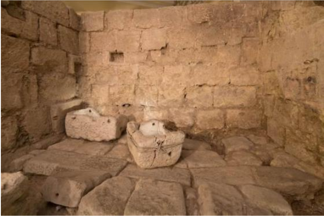
Abb. 4 - Überbauter Bereich mit den beiden Steintrögen.