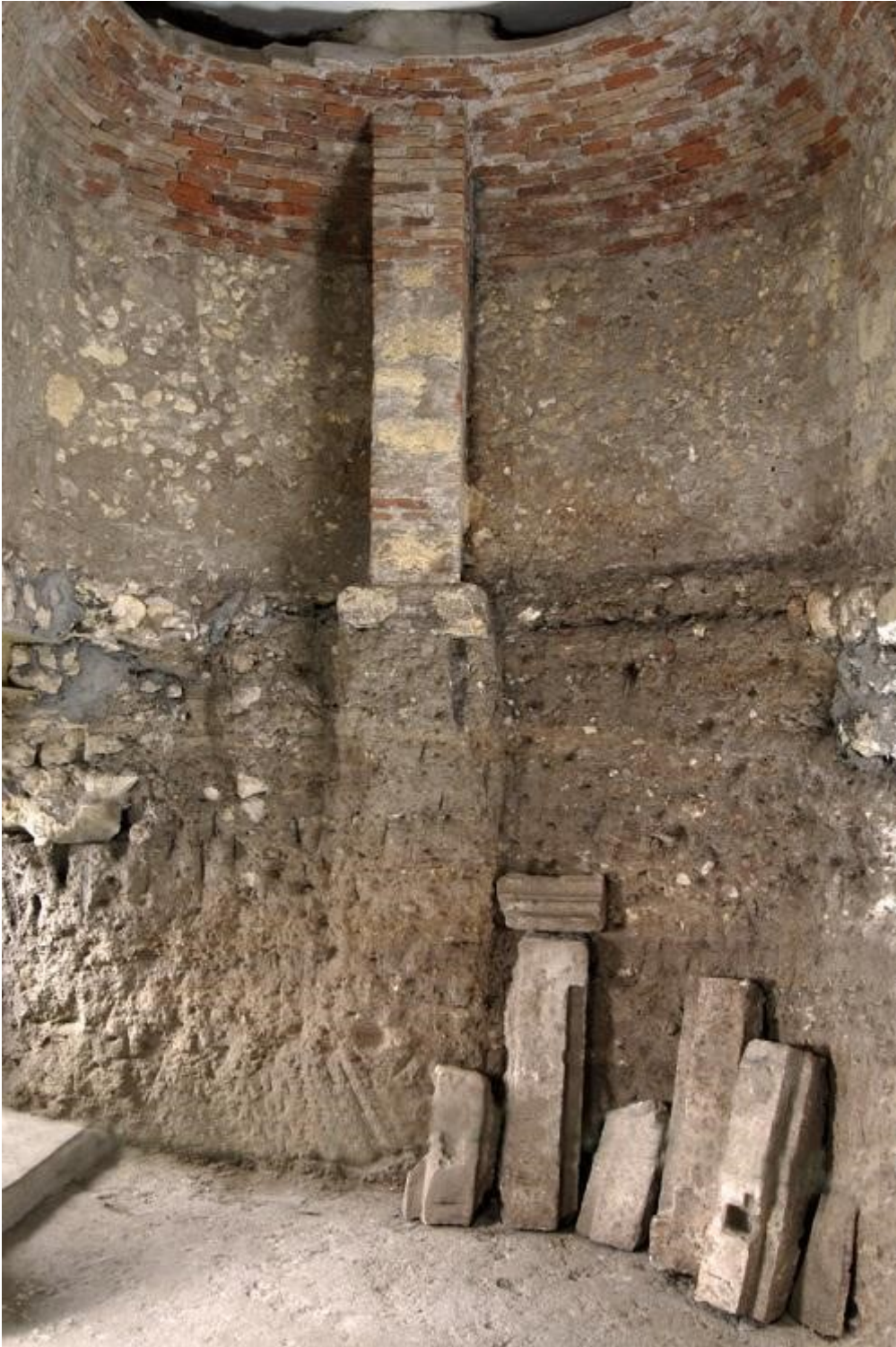
Abb. 10 - Eine seitliche Bestattungskrypta.