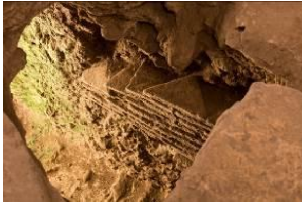
Abb. 3 - Abschnitt der Kanalisation, zum Teil in den Fels gegraben, zum Teil aus Ziegeln gebaut.

Zeitgleich mit der Straße ist ein privates Wohngebäude mit Schwelle aus Stein, das noch die Löcher für die Türangeln aufweist. Die Entwertung eines Teils desselben belegt die Veränderungen, die zwischen dem 5. und dem 6. Jahrhundert durch die Verschmälerung der Straße vorgenommen wurden. Der Mauerabschnitt zur Abgrenzung der Straße wurde in der Rahmenteknik ausgeführt, bestehend aus einer Reihe von geradlinigen in regelmäßigen Abschnitten aufgestellten Steinelementen, die die Verbindung zu den Zwischenräumen darstellten. Auf der anderen Seite der Straße befand sich eine weitere Insula, die wenig später als die erste ist, gegliedert in verschiedene Räume, darunter ein Innenhof mit Brunnen und Latrine, zwei Rampen sowie zumindest ein Obergeschoss. Dahinter befinden sich Räume mit einer Zisterne, zu denen im 6. Jahrhunderts weitere im südöstlichen Bereich hinzukamen. Diese neuen Räume dienten zur Überbauung und darauf wurden Steintröge aufgestellt, die eine neue Gebrauchsbestimmung belegen, die den gesellschaftlichen und wirtschaftlichen Wandel des Bezirks anzeigen (Abb. 4).