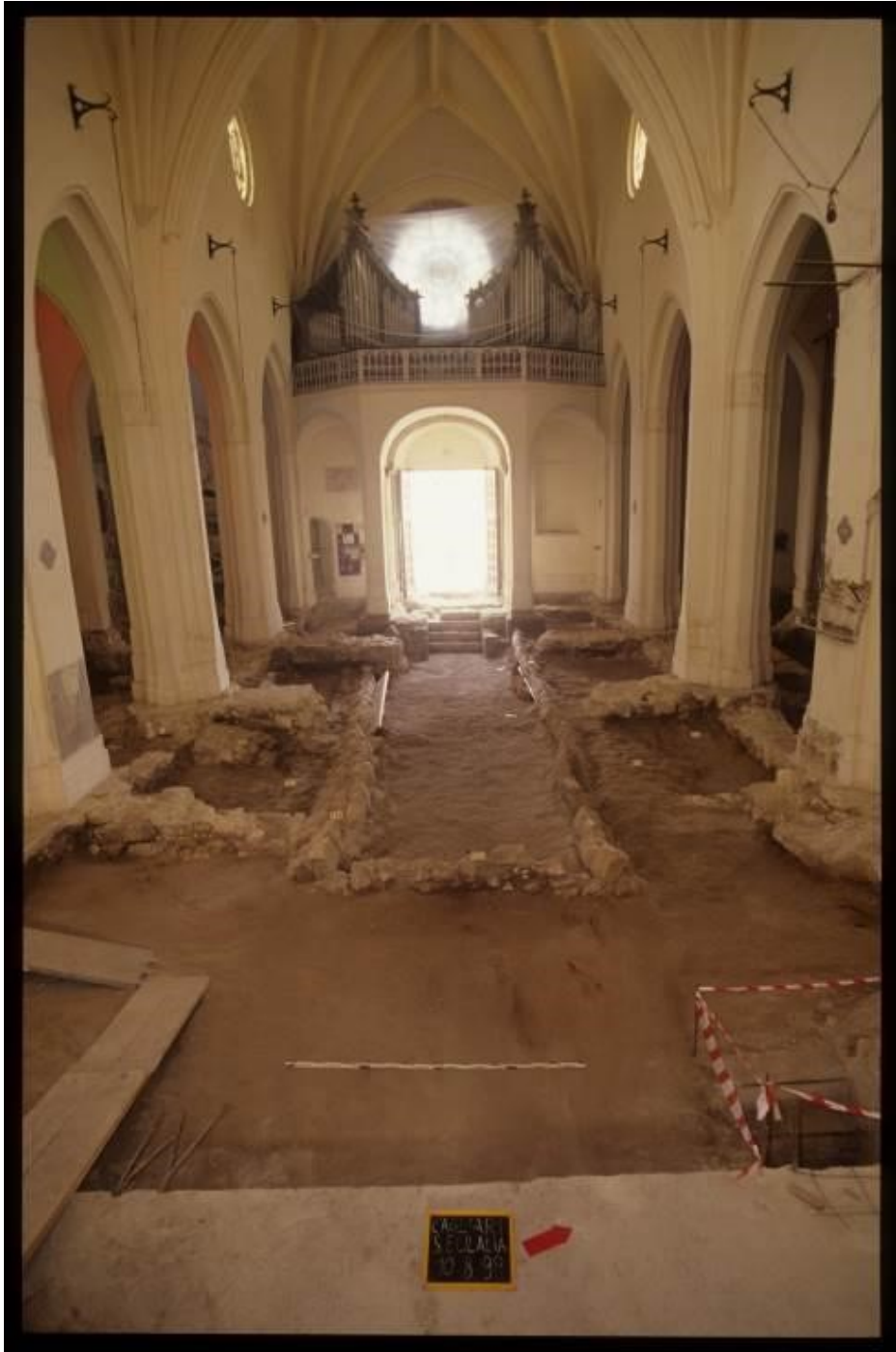
Abb. 8 - Innenansicht des Mittelschiffs der Kirche Sant'Eulalia während der ersten Grabungsarbeiten (Foto von AFS).