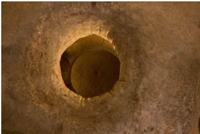
Abb. 6 - Öffnung der Flaschenzisterne (Foto von Unicity S.p.A.).

nur schwer bestimmt werden, da die archäologischen Überreste teilweise von der Kirche überbaut wurden; die Innenwand wies einen farbigen Putz auf. Der Baukörper wies ein Dach mit Ziegeln auf, verziert Gorgonen und Akanthusblättern aus Ton, Werke von römischen Arbeitern, die zu Beginn der Kaiserzeit tätig waren. Der Innenraum wies einen Bodenbelag aus unregelmäßigen Platten aus Kalkstein und Marmor in einem Bett aus Kalk auf, das die Öffnung einer Flaschenzisterne aufwies (Abb. 6). Diese Zisterne sicherte die Wasserversorgung des Bezirks, wie Fragmente von Amphoren belegen, die auf dem Boden gefunden wurden. Zum Zeitpunkt des Funds wies die Öffnung der Zisterne (Abb. 6) einen Verschluss aus Stein auf, der eigens angefertigt wurde, um die kleinen Münzvorräte zu schützen, die bei Gefahr in der Zisterne versteckt wurden, als der Bezirks nach und nach seine Funktion verlor. Hinter der Außenmauer des Portikusses wurde ein Kanal für den Ablauf des Wassers gefunden, der Teil eines größeren Projekts war: An der Mauer war außerdem eine Reihe von Ziegeln befestigt, die es gestatteten, ein Luftkammer zur Isolierung gegen Feuchtigkeit zu bilden. Davor legen eine Reihe von weiteren Kanälen sowie eine abgesenkte Ebene das Vorhandensein einer Tierbepflanzung nahe, um den Rahmen zur Kolonnade zu bilden, und mit Sicherheit führte ein kleiner Kanal zu einem Wasserreservoir.