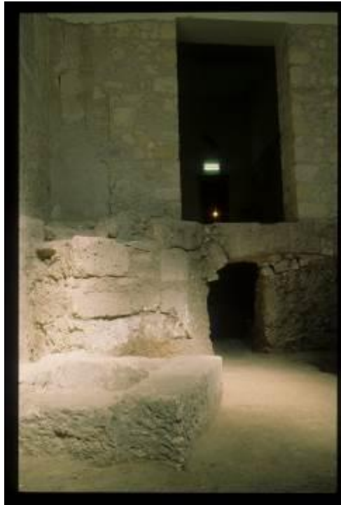
Abb. 1 - Der erste Fund: Aufsatz des Brunnens und Scheidemauern an der Sakristei.