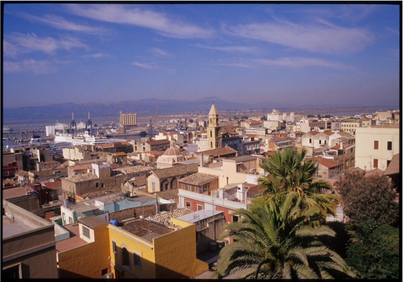
Abb. 4 - Gesamtdarstellung des Stadtviertels Marina, über das sich der Glockenturm von Sant'Eulalia erhebt.

Die Eingriffe, die während dieses langen Zeitraums durchgeführt wurden, sind Teil eines umfangreichen Projekts, das der Didaktik durch die Beziehung von jungen Archäologie-Studenten, die an vielen Kursen auf der Fundstätte teilgenommen haben, großen Raum eingeräumt hat. Durch die Musealisierung des Bezirks, die es gestattet hat, diesen archäologischen Komplex für die städtische Gemeinschaft wieder nutzbar zu machen und gleichzeitig das Überleben von Jahrhunderten von verschütteter Geschichte im kollektiven Gedächtnis zu garantieren, wird das gesamte Programm noch weiter aufgewertet.