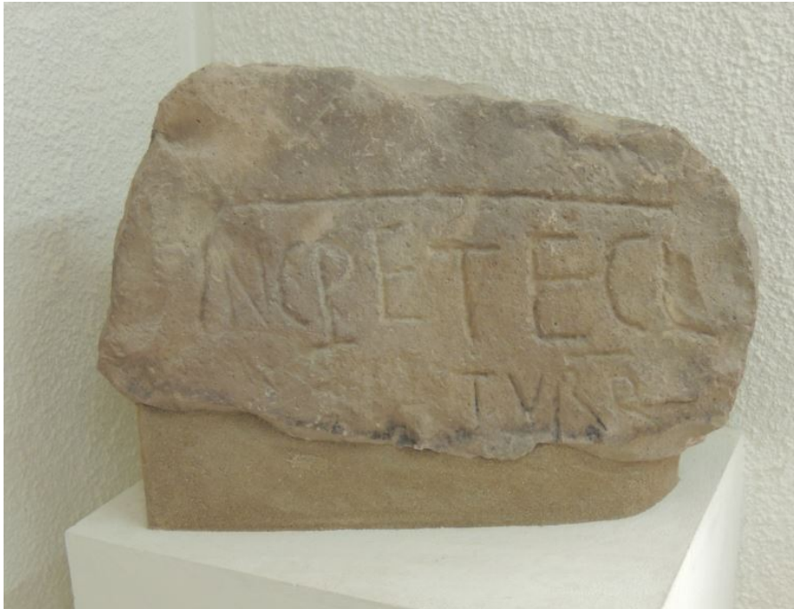
Abb. 4 - Santa Lucia, Grenzstein. Archäologisches Museum von Bonorva.

Im mittelalterlichen Latein ist der Begriff petia gut belegt und er findet sich auch im Condaghe von S. Pietro di Sorres (Karte 320), wo ein pecju de terra zitiert wird. Es ist daher wahrscheinlich, dass das Grundstück, das sich nördlich der Kirche Santa Lucia bis zur Kirche S. Andrea Priu erstreckt, zum Eigentum der bischöflichen Kurie von Sorres gehörte und nach ihrer Auslöschung im Jahr 1503 zu den Gütern der „ Ecclesia “ Turritana fiel.