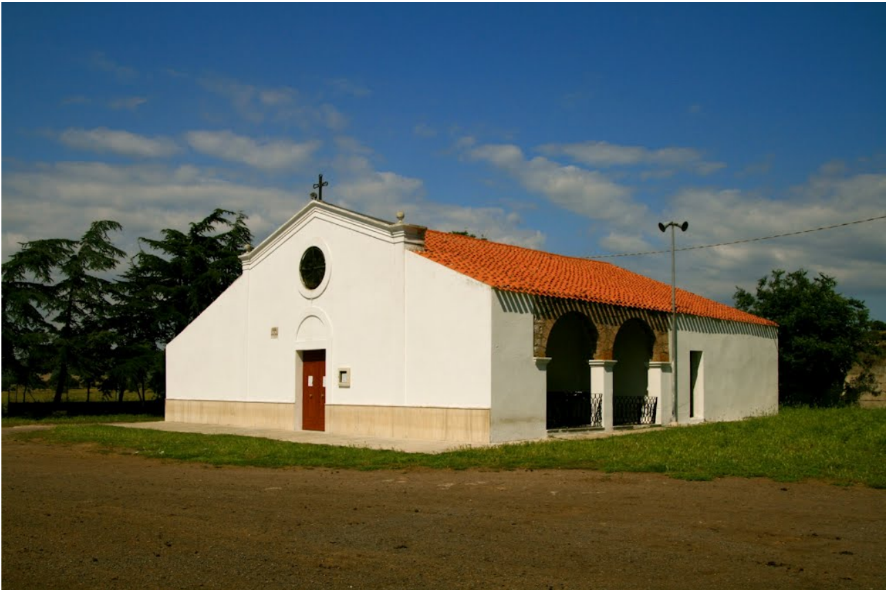
Abb. 3 - Detail der Kirche S. Lucia.

Das Alter der Kirche wird durch die Ortsbezeichnung „Piana di Santa Lucia“ belegt, das heißt die Ebene, die sich zumindest 4 Kilometer nach Norden erstreckt, bis nach Funtana Sansa, wo sich die Quelle Santa Lucia befindet. Um die Kirche herum befand sich auch ein Komplex von cumbessias , kleinen Häusern, Unterkünften für Pilger beim alljährlichen Fest zu Ehren der Heiligen, wie die Überreste der Fundamentmauern belegen, die auf dem großen Platz noch sichtbar sind.