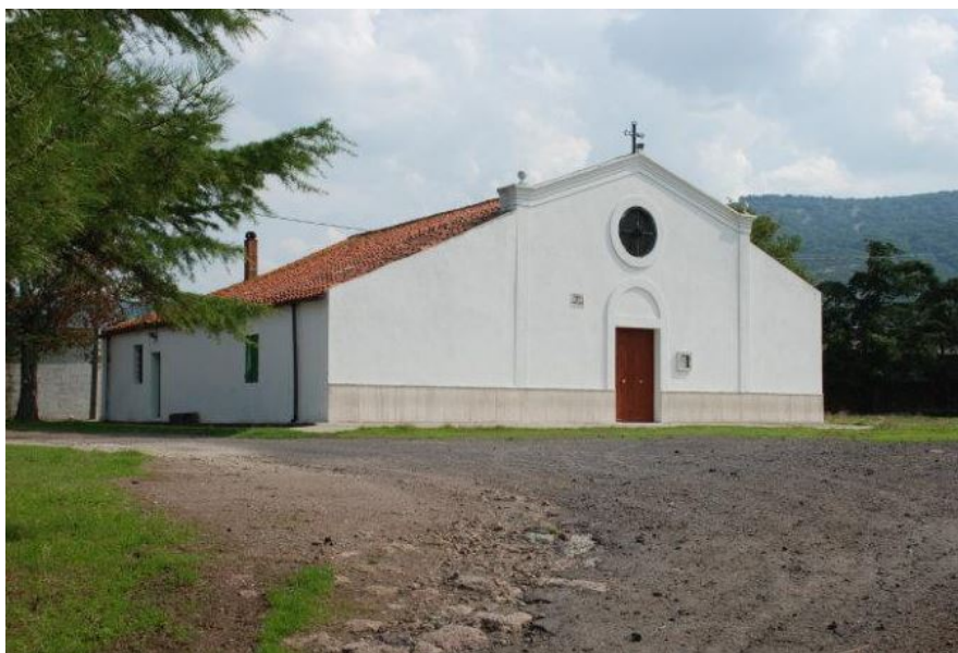
Abb. 2 - Die Kirche S. Lucia (Foto von Giuseppe Oppo, von http://wikimapia.org/18316023/it/Chiesa-campestre-di-Santa-Lucia#/photo/1548204 ).