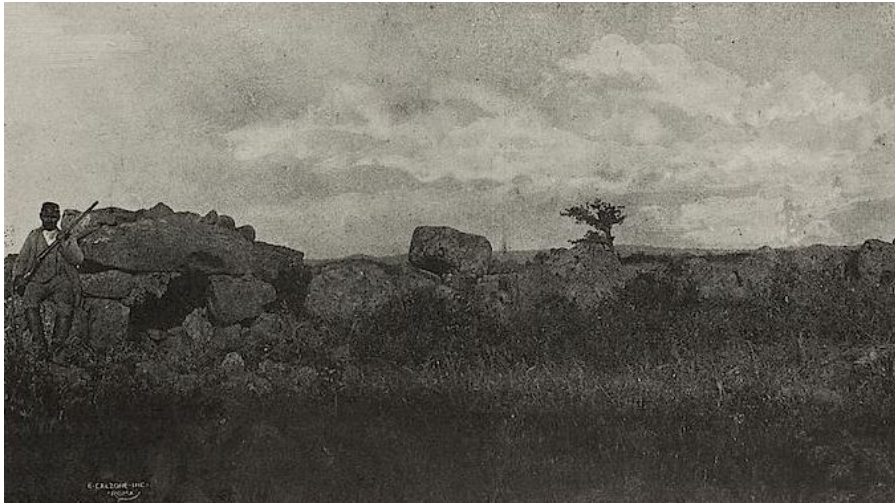
Abb. 3 - Altes Foto der Einfriedung von Mura de Sos Alvanzales (aus: Taramelli 1919, Abb. 15).

An den Rändern der Hochebene wurde im Gebiet von San Simeone, unweit der muras die Stelle gefunden, an der sich die punische Festung befand, datiert auf das 5. Jahrhundert v. Chr., von der noch die Überreste von zwei Türmen sichtbar sind, die die Siedlung gegen Überfälle durch die nahen Bevölkerungen schützten. Der Standort wurde aufgrund seiner strategischen Lage sowie seiner Nähe zur Straße a Karalibus Turrem wahrscheinlich auch in der Römerzeit als militärischer Vorposten genutzt.