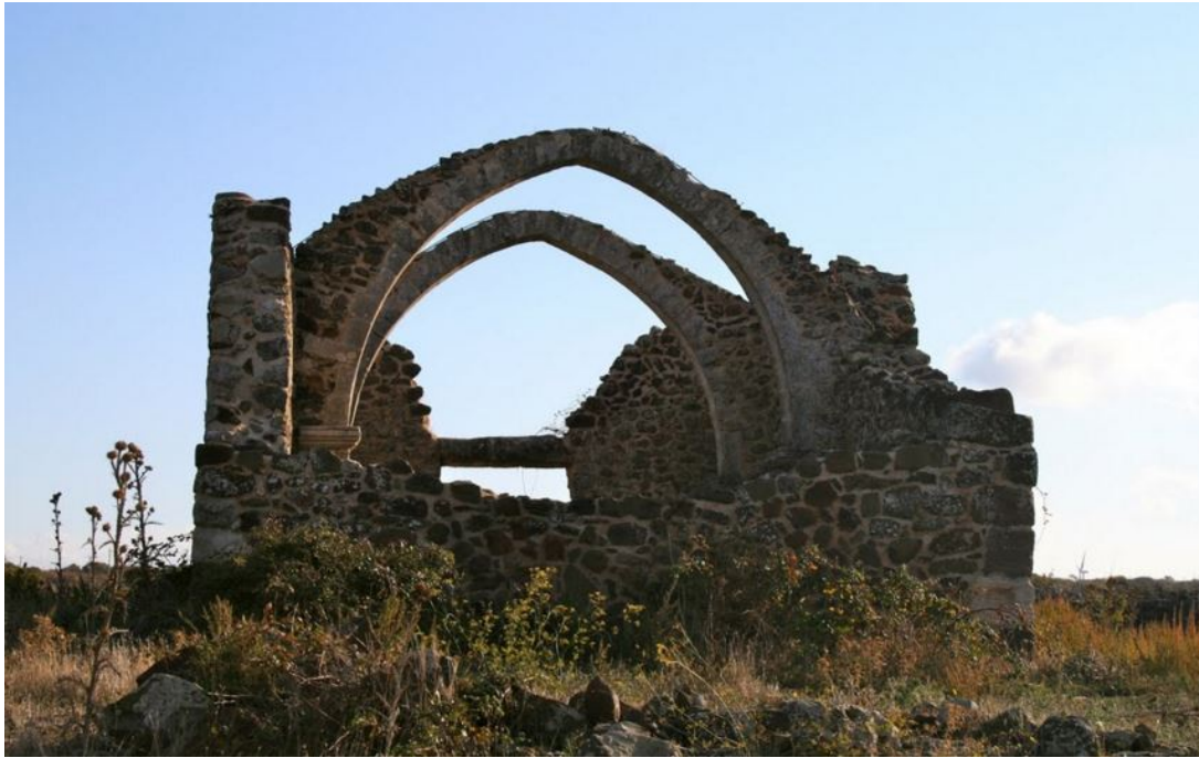
Abb. 4 - Die Ruine der Kirche S. Simeone, Bonorva.

Die San Simeone geweihte Wallfahrtskirche wurde um das Jahr 1354 auf der Hochebene von Campeda errichtet, oberhalb des Semestene-Tals nach Bonorva, und war mit Sicherheit eine der ersten Siedlungen der Bewohner von Bonorva. Die Bewohner blieben aufgrund des ungesunden Klimas jedoch nur 30 Jahre und siedelten sich dann weiter talwärts in der Nähe einer Kirche an, wo die ersten Häuser des neuen Orts errichtet wurden. Als Erinnerung sind einige Ruinen und die eingefallenen Mauern erhalten, die gegen Ende des 19. Jahrhunderts von Vittorio Angius und Alberto La Marmora gemeldet wurden, die sie irrtümlich der Römerzeit zuschrieben, sowie einige Bögen der dem Heiligen geweihten Kapelle.