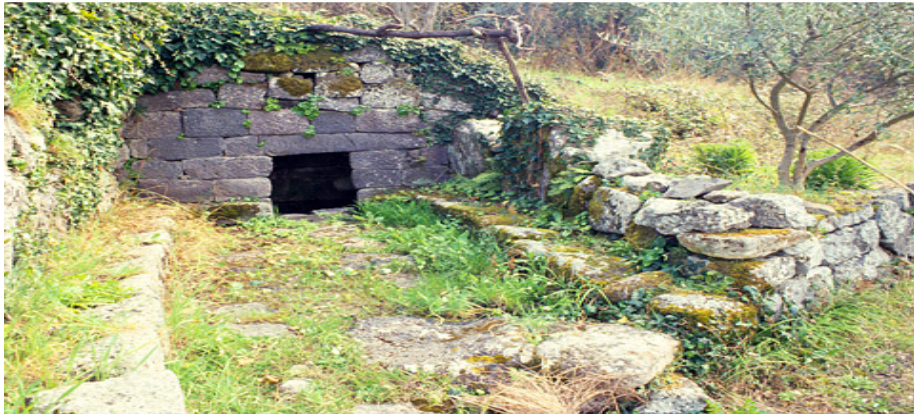
Abb. 4 - Nuraghische Quelle von Su Lumarzu.