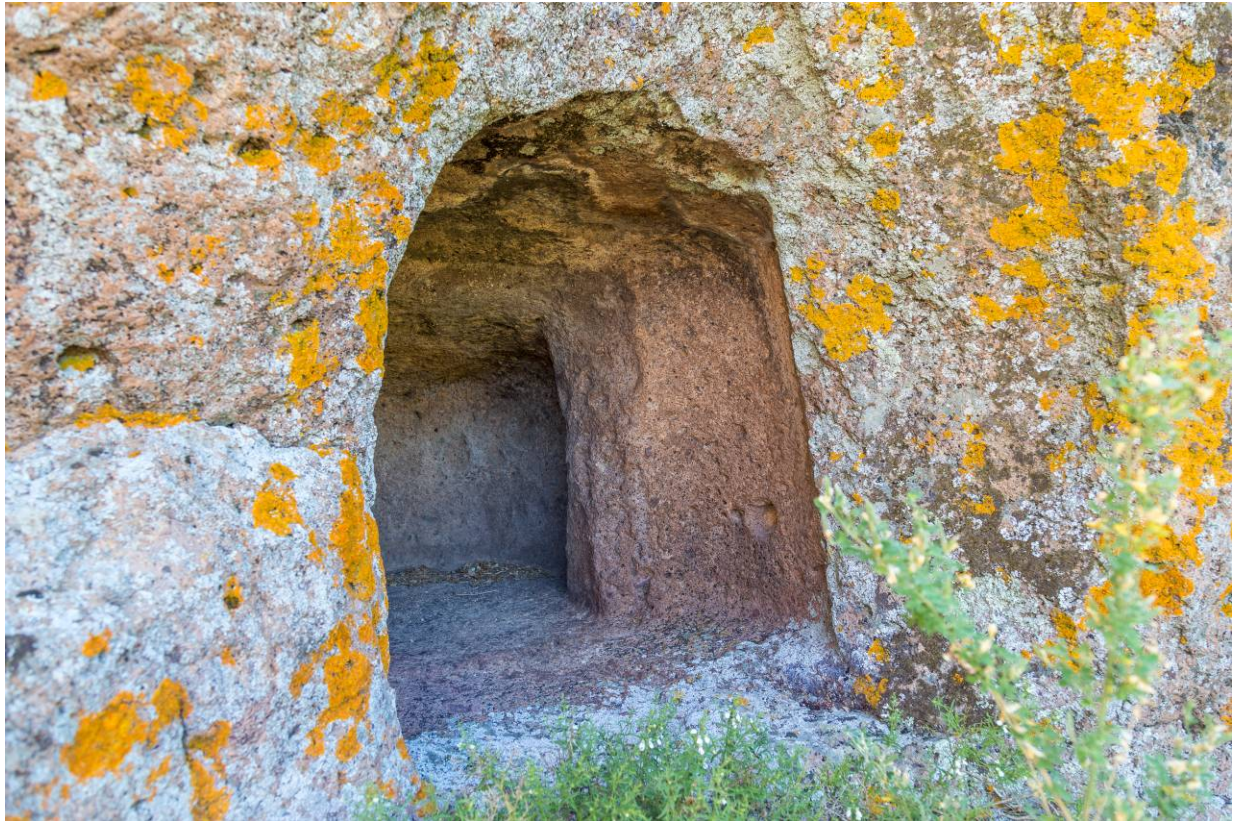
Abb. 5 - Unterirdischer Raum XV.

Der unterirdische Raum XV (Abb. 5) befindet sich im äußersten Westen der Hochebene, ca. 15 Meter südwestlich der Gruppe der unterirdischen Räume XIII und XIV. Sie besteht aus einer Zelle mit ovaler Vorzelle mit nach innen überstehender Decke sowie einer kleinen Ofenzelle.