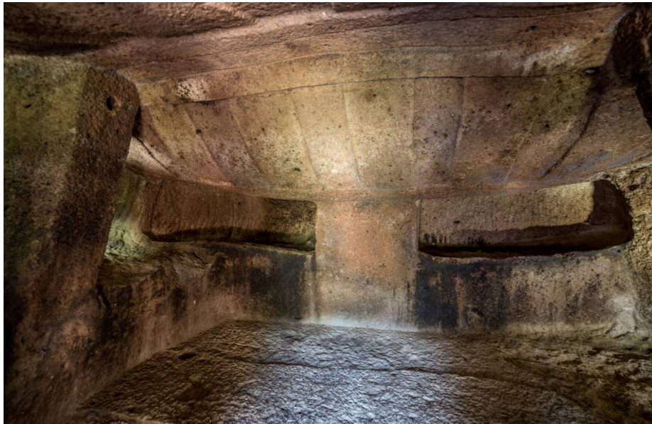
Abb. 4 - Die beiden Scheinnischen.

Das Dach wird von zwei Pilastern getragen, von denen einer (der linke) auf einer auf der linken Seite ausgesparten Bank ruht und so zwei Scheinnischen bildet (Abb. 4 , 5).