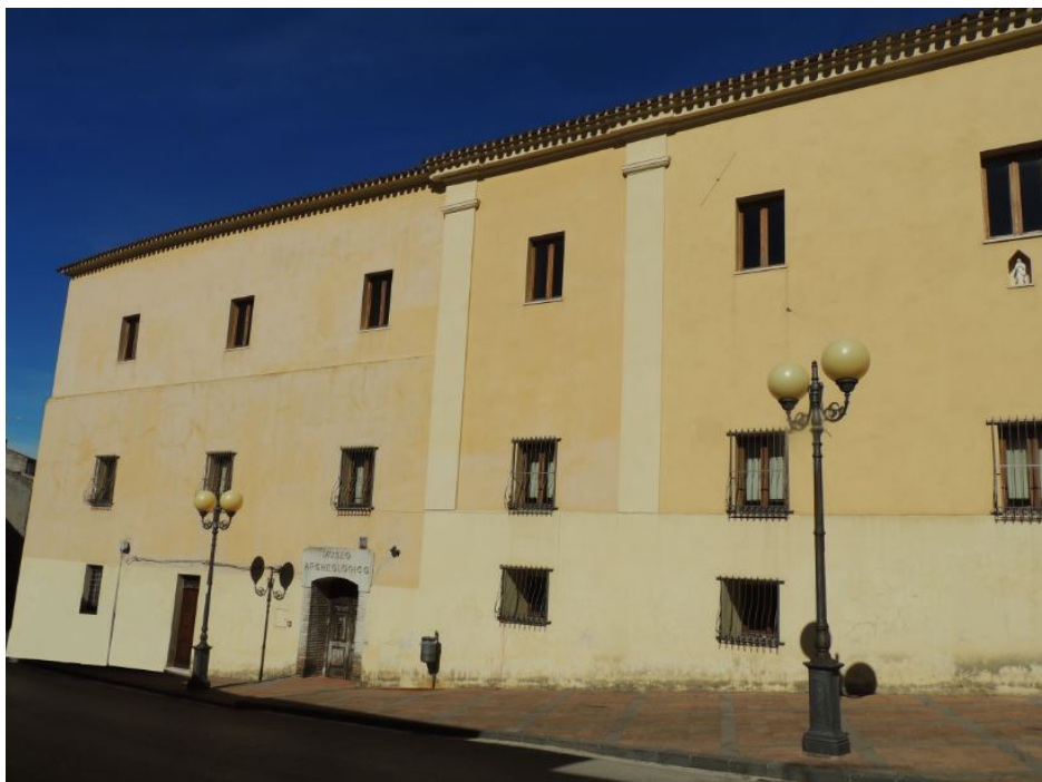
Abb. 1 - Das Gebäude des ehemaligen Konvents, in dem sich das Museum befindet

Das Städtische Archäologische Museum von Bonorva befindet sich in einem Teil des ehemaligen Franziskanerkonvents mit angrenzender Kirche Sant'Antonio im historische Kern des Orts (Abb. 1).