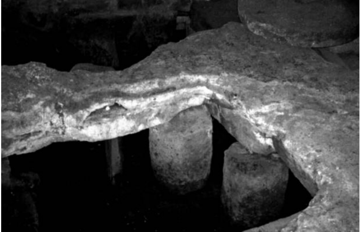
Abb. 4 - Die Meilensteine, die den Bodenbelag des Raums 2 tragen (aus: Mastino, Ruggeri 2009, S. 562, Abb. 8).

Die Meilensteine weisen Widmungen an Kaiser aus dem 3. und 4. Jahrhundert auf und stellen den terminus post quem für die Errichtung der Thermenanlage dar.