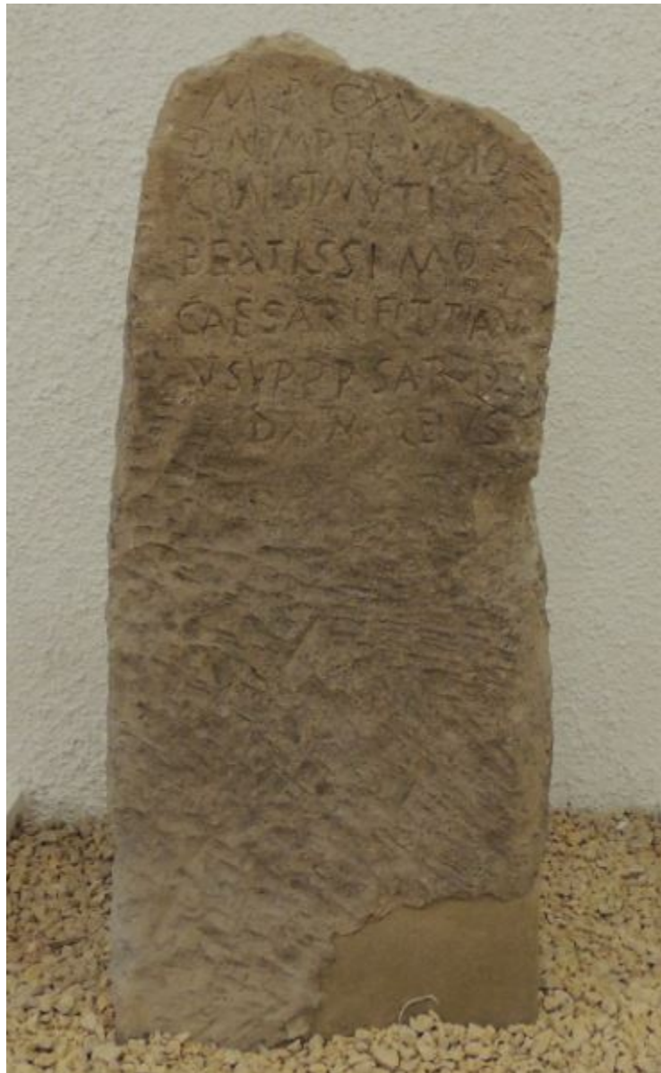
Abb. 1 - Meilensein aus der Ortschaft Mura Menteda, Archäologisches Museum von Bonorva.