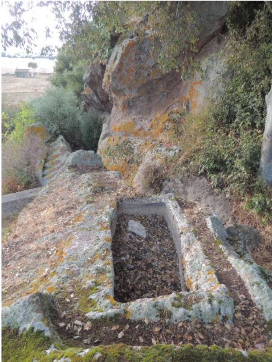
Abb. 4 - S. Andrea Priu, das Grab außerhalb der Felsenkirche.