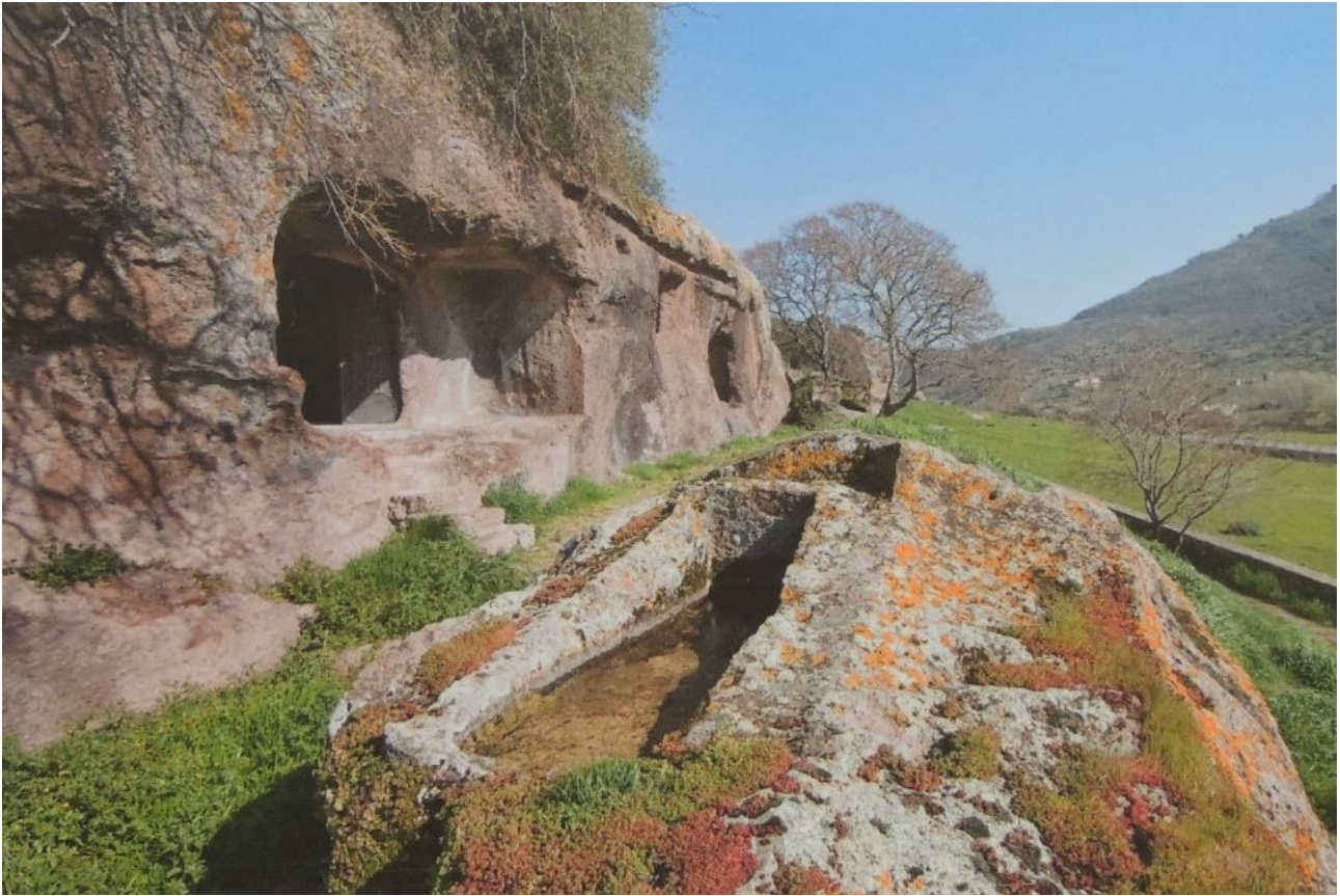
Abb. 3 - S. Andrea Priu, das Grab außerhalb der Felsenkirche (aus: Area di Bonorva).