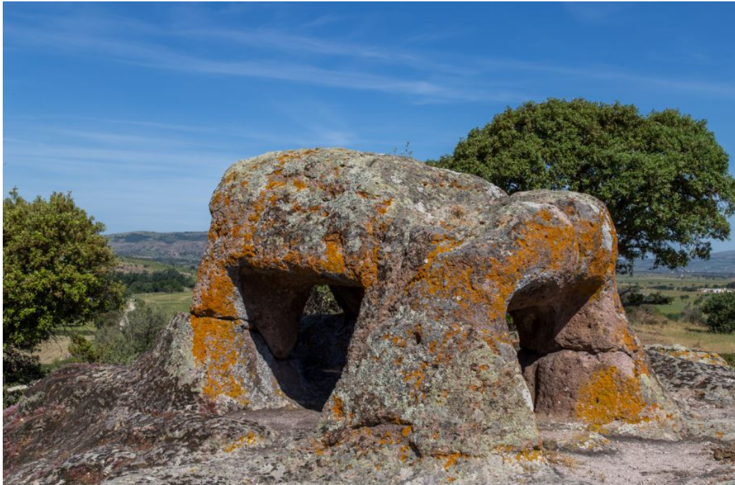
Abb. 3 - Detail des „Glockenturms“ oder „Stiers“.