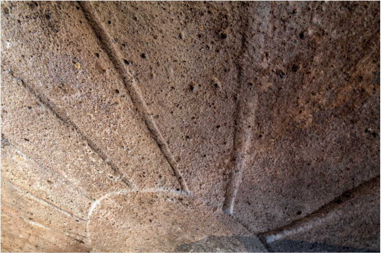
Abb. 3 - Die Decke des Endonarthex.

Eine zwei Meter hohe und 1,45 Meter breite Tür, gekrönt von einem Architrav, gestattet den Durchgang vom Narthex zur Aula (Abb. 4-5).