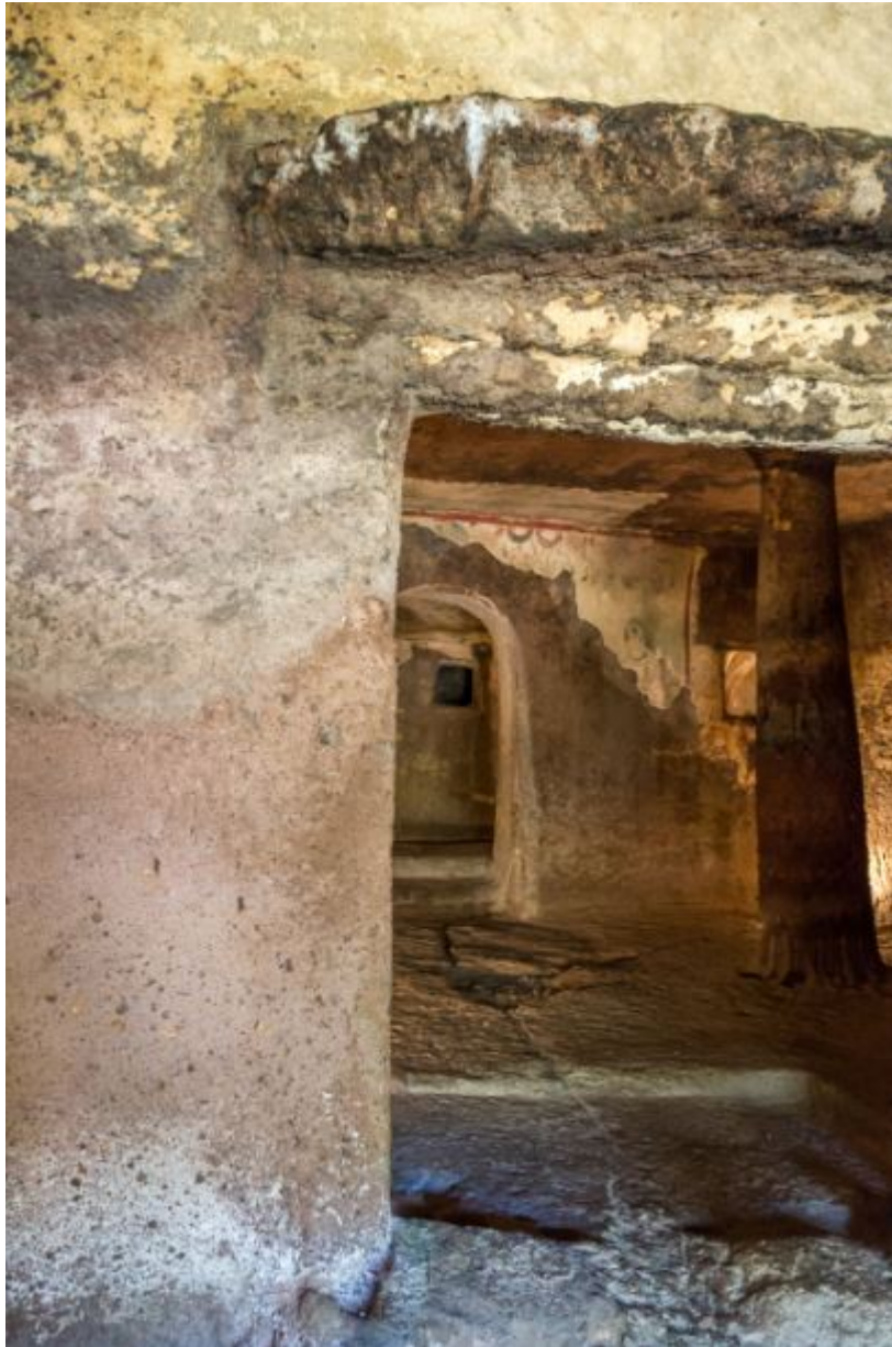
Abb. 4 - Die Tür, die den Durchgang vom Narthex zur Aula gestattet.