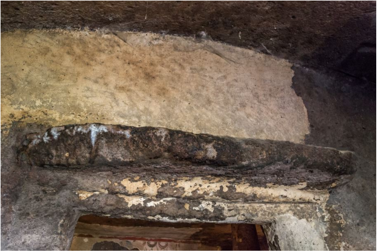
Abb. 5 - Detail des Architravs.

Als das Grab in eine Kirche umgewandelt wurde, haben diese beiden Räume (Exonarthex und Endonarthex) jedoch ihre ursprüngliche Besonderheit aus prähistorischer Zeit beibehalten. Die einzige Umwandlung bezieht sich auf die beiden Gräber im Boden des Endonarthex, die während der byzantinischen Zeit genutzt wurden. Die an der Decke vorhandenen Spuren von rotem Ocker (Abb. 6) stammen aus der prähistorischen Epoche, während die Spuren von Putz über dem Architrav der Nutzung des Raums im Mittelalter zuzuschreiben sind.