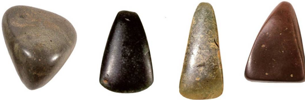
Abb. 3, 4, 5, 6 - Arzachena, Necropoli di Li Muri, accette litiche (da ANTONA 2013 p. 83).

Es handelt sich um ein recht weitverbreitetes Werkzeug, das der Produktion aus geschliffenem Stein angehört und in prähistorischen Wohnkontexten häufig zu finden ist (Abb. 3, 4, 5, 6).