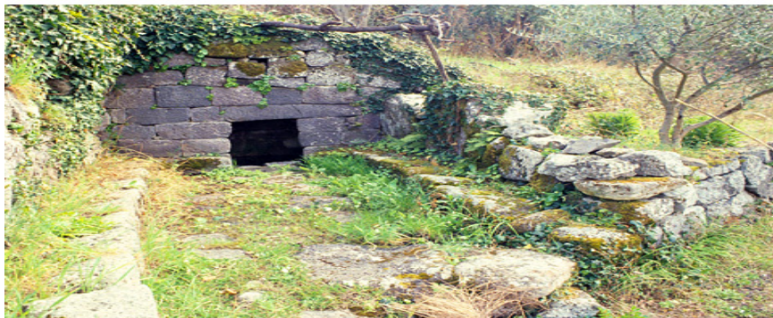
Abb. 1 - Nuragische Quelle von Su Lumarzu.

In Fontana Lumarzu bei Rebeccu a Bonorva (Abb. 1) wurde zu Beginn des 20. Jahrhunderts eine besondere Miniatur-Vase mit Votivcharakter (Abb. 2) gefunden, die auf den Zeitraum zwischen Ende der Bronzezeit und Beginn der Eisenzeit datiert wird.