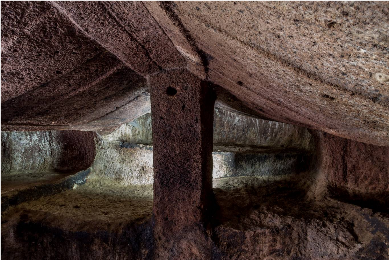
Abb. 6 - Detail of the ceiling that characterises the domus de janas VIII at S. Andrea Priu, known as the “Tomba a camera”.

Der Bestattungskomplex wurde nicht nur in der nuraghischen Zeit wieder genutzt, sondern auch in den nachfolgenden Phasen des römischen Reiches und der Spätantike, als das Grab VI, bekannt als „Grab des Stammesführers“ (Abb. 7), eine domus aus 18 Räumen, in eine christliche Kultaula umgewandelt und bis ins frühe Mittelalter als Felskirche genutzt wurde.