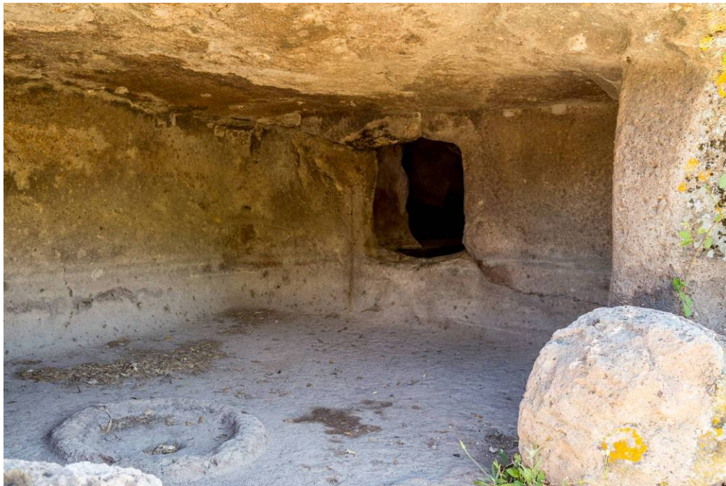
Abb. 4 - Detail der kultischen Feuerstelle, die im Boden der Vorzelle der domus de janas XIII von S. Andrea Priu ausgespart ist.

Die religiöse Ideologie der pränuraghische Bevölkerung wurde durch eine Reihe von architektonischen und dekorativen Details sowie durch symbolische Elemente zum Ausdruck gebracht, mit denen die domus de janas ausgestaltet wurden, wie zu sehen an den Wände und auf den Bodenbelägen der domus von Sant'Andrea Priu (Abb. 4). Diese Elemente sind - zusammen mit der Anlage der unterirdischen Räume - nützlich zur Rekonstruktion der prähistorischen Wohnhäuser, deren Überreste nicht ausreichend sind für eine vollständige Rekonstruktion der pränuraghischen Wohnhäuser. Die Archäologin Giuseppa Tanda hat auf der Grundlage einer Zusammenfassung der architektonischen Elemente der domus de janas eine „konkrete Hypothese zur Rekonstruktion der pränuraghischen Wohnhäuser“ formuliert und dabei zwischen 9 architektonischen Modellen unterschieden.