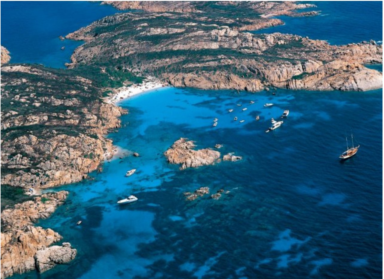
Abb. 3 - Gesamtaufnahme des Golfes von Arzachena.

Charakteristisch für die Gallura sind die vereinzelt „ Stazzi “, landwirtschaftliche Betriebe, geführt von einer Familie und in der Regel autark, gegründet von Hirten, von denen viele im 17. und 18. Jahrhundert aus dem nahen Korsika gekommen sind. Der Bautyp der Wohnhäuser der Hirten war recht einfach, normalerweise mit rechteckigem Grundriss, starken Mauern aus Granit, dem lokalen Stein, und Dach mit zwei Walmflächen auf einfachen Dachstühlen aus Wacholder (Abb. 4).