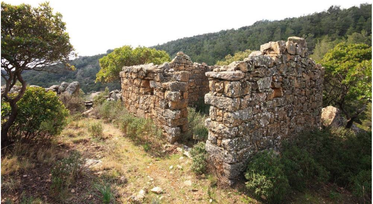
Abb. 4 - Stazzo del Monte Limbara.