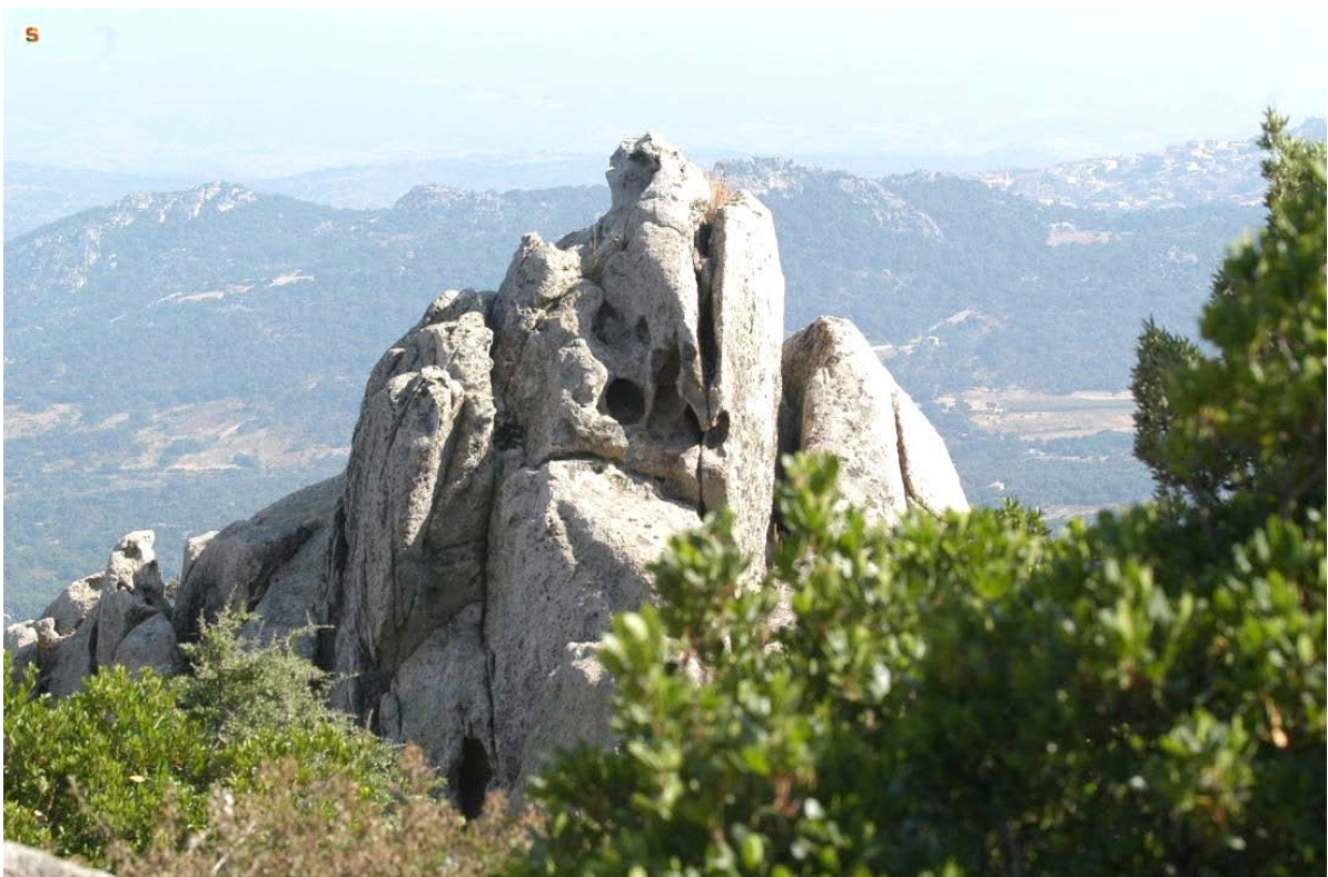
Abb. 1 - Aggius, Landschaft der Gallura (von http://www.sardegnaigitallibrary.it/index.php?xsl=626&s=17&v=9&c=4461&id=436898 )

Die Attraktion der Gallura besteht zu einem guten Teil aus den reizvollen Landschaften: im ständigen Wechsel der Gesteinsformationen und der unterschiedlichen Weisen des Menschen, sich an das Territorium anzupassen (Abb. 1).