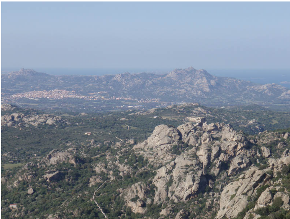
Abb. 1 - Übersicht über das des Gemeindegebiets (von http://www.bbliconchi.com/images/info800x/10.jpg ).

Die lokale Aussprache der modernen Ortsbezeichnung ist Alzachèna, Arzaghèna: Laut Massimo Pittau handelt es sich dabei um eine Ortsbezeichnung protosardischen Ursprung, mit dem charakteristischen nuraghischen Suffix -èna, im Zusammenhang mit Artakené, Epithet der Hera, der Göttin der Stadt Artàke in Trakien, im Hellespont, in Beziehung zum Heraion von Ptolemäus, gemäß Pittau vielleicht in Tempio; dies würde eine Beziehung zwischen Sardinien und Kleinasien belegen (Abb. 1).