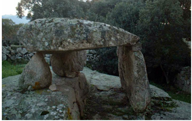
Abb. 3, 4 - Dolmen von Ladas und von Bilella im Territorium von Luras-SS (von http://www.sardegna-digitallibrary.it/mmt/480/100931.jpg e http://www.sardegna-cultura.it/immagini/7_112_20090430125045.jpg ).