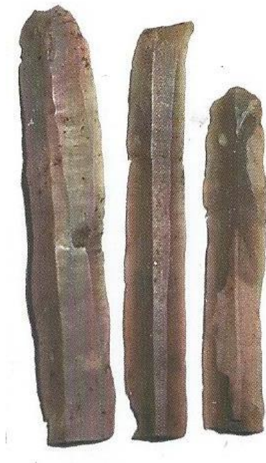
Abb. 1 - Klingen aus Feuerstein aus Li Muri di Arzachena (aus: Mancini 2011, S. 15).

Spuren menschlicher Anwesenheit finden sich in Gallura seit der Altsteinzeit, wie in der Nähe des Ufers die Spuren von Werkstätten für die Bearbeitungen von Obsidian und sardischem Feuerstein belegen, die für die Herstellung von Werkzeugen für den täglichen Gebrauch verwendet wurden und die mit dem Handel dieser Rohstoffe im westlichen Mittelmeerraum über Korsika in Zusammenhang stehen (Abb. 1).