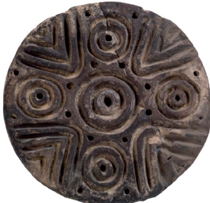
Abb. 4 - Pintadera von der Nuraghe von Genna Maria di Villanovaforru.