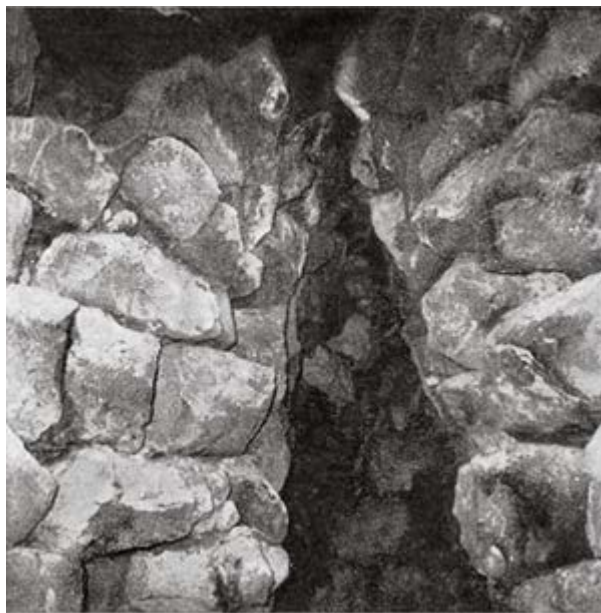
Abb. 3 - Zugang zur Kammer des Turms E (aus: Lilliu 1962, Tafel LXV.2, S. 337).

Links vom Zugangskorridor befindet sich ein Wachposten mit halbrundem Grundriss, der während der Phase C (12. bis 10. Jahrhundert v. Chr.) in ein Becken zum Auffangen von Regenwasser umgewandelt wurde. Der Turm E, der ursprünglich aus zwei Kammern übereinander bestand, weist an der Basis einen Durchmesser von 4,40 m und eine Höhe des